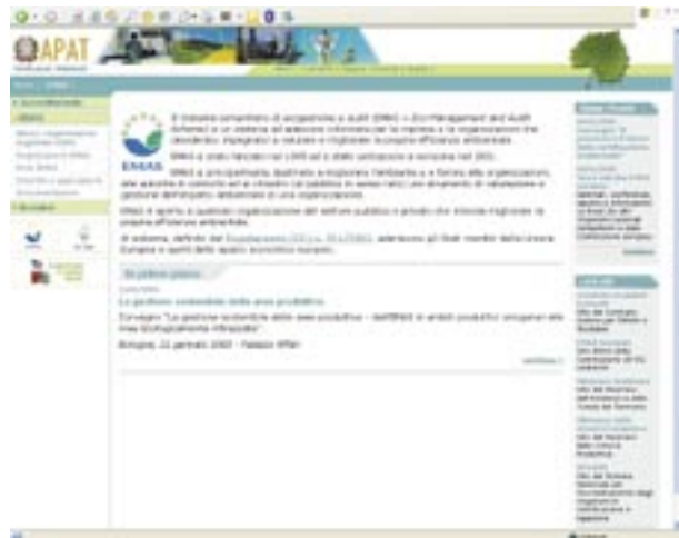
Figura 30 - Sito web istituzionale

di istruzioni per l'uso. Tra queste, meritano una particolare attenzione le pubblicazioni della Germania 5 e del Regno Unito 6 .