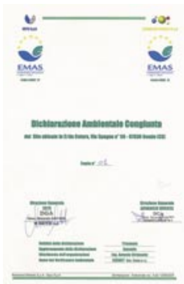
Figura 14 - Loghi sul frontespizio di una dichiarazione ambientale relativa a due organizzazioni

mare le organizzazioni, contestualmente alla comunicazione della avvenuta registrazione e dell'assegnazione del relativo numero di registro, sull'uso del logo fornendo anche le indicazioni sulla relativa specifica tecnica e sul formato elettronico messo a disposizione sul sito web dell'APAT. Oggi quasi il 100% delle dichiarazioni ambientali riporta il logo nella forma corretta nella copertina anteriore. La figura 14 rappresenta un caso forse unico in Europa per