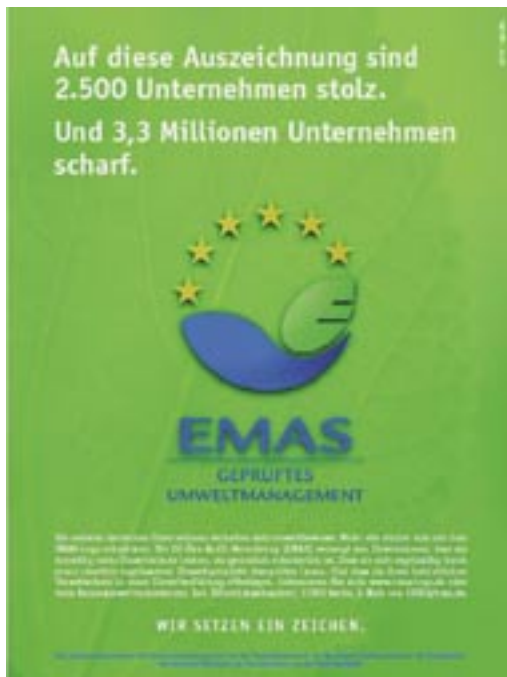
Figura 9 - Esempio di utilizzo non corretto del logo per scopi promozionali su un poster

Sarebbe auspicabile un comportamento omogeneo sia a livello nazionale, sia a livello europeo e questo non può che avvenire attraverso un'adeguata e capillare attività di informazione da parte delle istituzioni che dovrebbero essere in prima linea nel fornire informazioni corrette alle imprese. La figura 10 invece rappresenta un esempio Italiano. Il Comitato Ecolabel Ecoaudit ha utilizzato questo poster per accogliere i rappresentanti di tutti i paesi UE convenuti a Torino per una riunione del Comitato istituito con l'art. 14