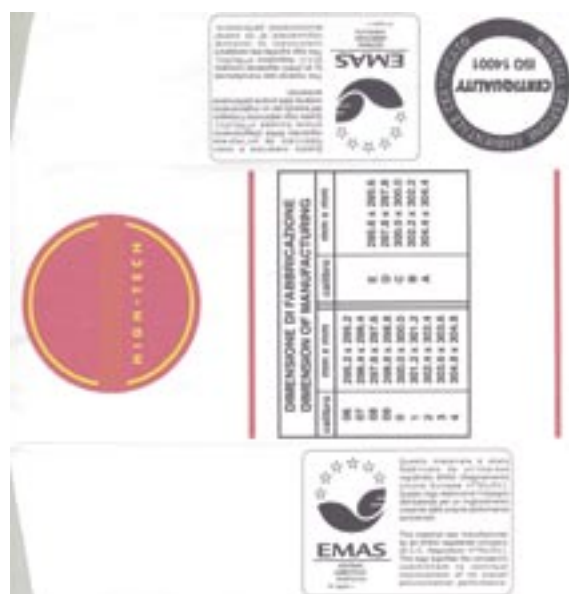
Figura 32 - Logo EMAS Packaging piastrelle ceramiche

La dicitura bilingue concordata in Italia per illustrare al pubblico il significato del logo era, per uno stabilimento di ceramiche, la seguente: “Questo materiale è stato fabbricato da un'impresa registrata EMAS (Regolamento dell'Unione Europea n. 761/01). Questo logo testimonia l'impegno dell'azienda per un miglioramento costante delle proprie prestazioni ambientali - This material was manufactured by an EMAS registered company (E.C.C. Regulation n. 761/01) This logo signifies the company's commitment to continual improvement of its overall environmental performance”. (figura 32)