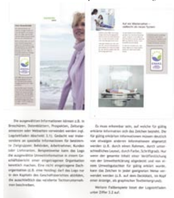
Figura 27- Pagina della DAP con informazioni EMAS

Si evidenzia che nel messaggio è sempre opportuno indicare il riferimento alla Dichiarazione Ambientale da cui sono state estratte le informazioni alle quali è associato il logo.