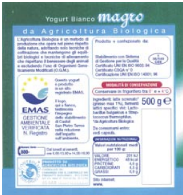
Figura 33 - Logo EMAS Packaging vasetti yogurt

La figura 33 mostra l'involucro che un produttore di yogurt avrebbe dovuto utilizzare. La frase recitava: "Questo yogurt è prodotto in un sito registrato EMAS (Regolamento CE n. 761/01). Il logo qui a fianco testimonia l'impegno dello stabilimento di .... nella riduzione dell'impatto ambientale".