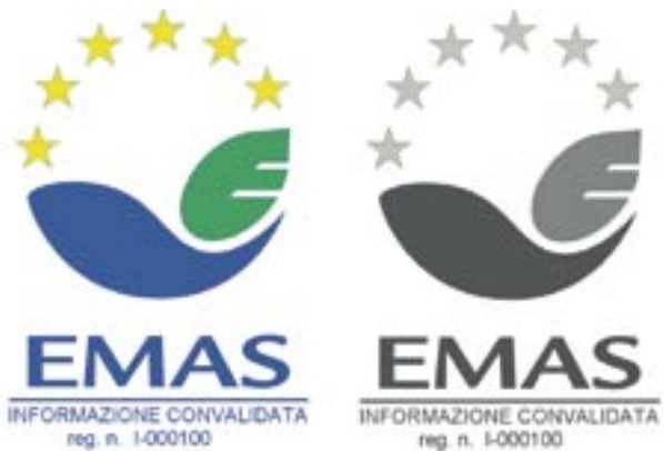
Figura 3 - Logo versione 2 a colori e bianco e nero

Per l'uso del logo nella dichiarazione ambientale (versione 2), nella carta intestata dell'organizzazione (versione 1) e nelle informazioni che pubblicizzano l'avvenuta registrazione (versione 1), non vi sono particolari prescrizioni e/o indicazioni. Per quanto concerne invece l'uso del logo su informazioni convalidate (versione 2) e sulla pubblicità di prodotti, attività e servizi dell'organizzazione (versione 1), il Regolamento rimanda alle disposizioni indicate nella relativa Linea guida (Decisione CE/681/01), che, quindi, assumono carattere di disposizioni cogenti.