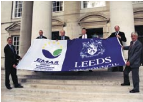
Figura 21 - Logo sulla bandiera del Comune di Leeds (UK) registrato EMAS

Altri esempi, degni di attenzione, sono offerti dall'impiego di bandiere; la figura 21 si riferisce al comune di Leeds nel Regno Unito.