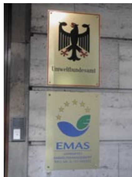
Figura 20 - Targa dell'Agenzia Federale per l'Ambiente Tedesca

La figura 20 mostra l'ingresso dell'Agenzia Federale per l'Ambiente della Germania.