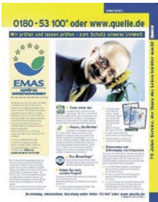
Figura 28 - Box informativo su EMAS nel catalogo generale di vendita

Una particolare attenzione dovrà essere riservata al rispetto dei requisiti dell'allegato III del Regolamento in fatto di rappresentatività del messaggio in relazione alle prestazioni ambientali dell'organizzazione (figura 28).