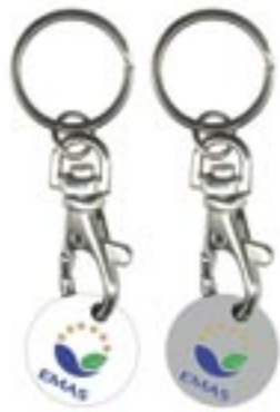
Figura 8 - Utilizzo del logo per scopi promozionali (gadget)

e/o delle organizzazioni (anche governative) che lo diffondono.