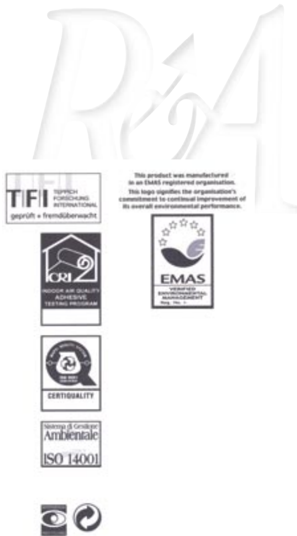
Figura 34 - Logo EMAS Packaging collante per edilizia

Si ribadisce che questi ultimi esempi sono relativi a casi