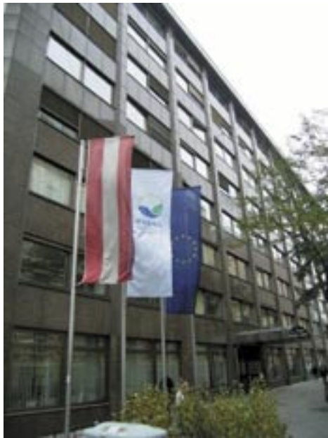
Figura 22 - Bandiera con logo al Ministero per l'Ambiente Austriaco

Anche la compagnia aerea Lufthansa comunica sui propri aeromobili con il logo EMAS l'avvenuta registrazione (figura 24).