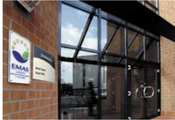
Figura 19 - Targa dell'azienda Storaenso (Germania)

La soluzione, in questo caso, non potrà che essere sempli