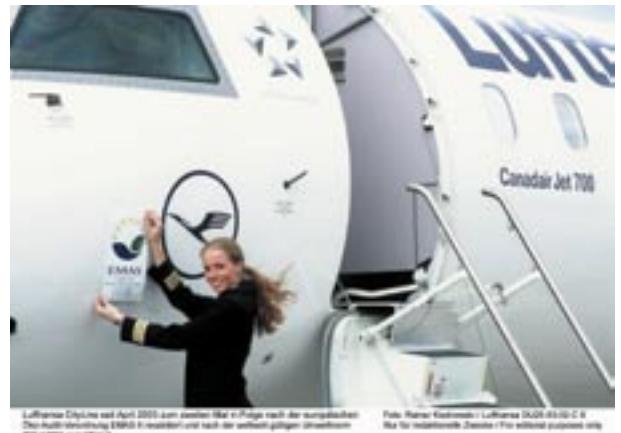
Figura 24 - Logo EMAS su un aeromobile della Lufthansa

Interessanti applicazioni, molto visibili, ci vengono dalla Germania nel settore dei trasporti. La società che gestisce le linee tranviarie di Colonia pubblica in modo molto evidente la propria partecipazione allo schema. L'estensione del messaggio pubblicitario sulla superficie della vettura suggerisce anche una serie di riflessioni a cominciare dall'evidente volontà del management aziendale di rinunciare ai proventi della pubblicità a favore della comunicazione ambientale (figura 23).