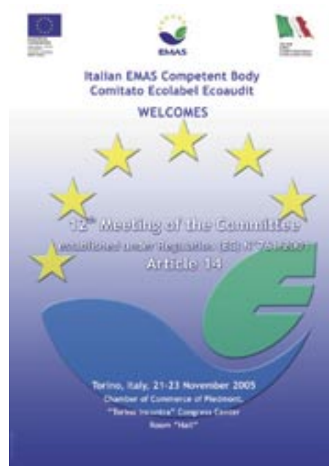
Figura 10 - Esempio di utilizzo corretto del logo per scopi promozionali su un poster