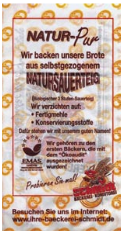
Figura 31 - Packaging terziario

sul “transport packaging” o “tertiary packaging” la Commissione UE si è espressa con parere positivo 7 .