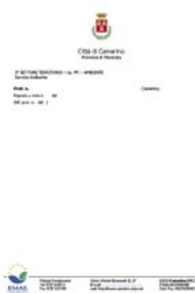
Figura 17 - Esempio di uso del logo su carta intestata

Questa possibilità era già consentita dalla precedente versione del Regolamento EMAS (1836/93). Si tratta essenzialmente di riportare, nella carta intestata dell'organizzazione, il logo EMAS, nella versione 1, con l'indicazione del numero assegnato nel registro delle organizzazioni EMAS ( figura 17 ).