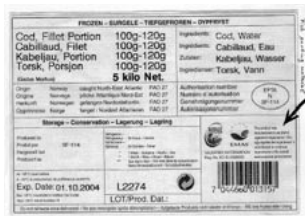
Figura 35 - Logo EMAS sull'involucro di una confezione di pesce surgelato (Norvegia)

attualmente non consentiti dal Regolamento. Sono stati inseriti in questo contesto per mostrare le potenzialità del logo qualora EMAS III ne permetterà l'applicazione nel contesto specificato.