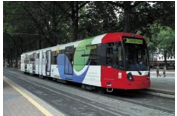
Figura 23 - Logo EMAS sulle vetture della società di trasporti di Colonia KVB (D) registrata

Altri esempi, degni di attenzione, sono offerti dall'impiego di bandiere; la figura 21 si riferisce al comune di Leeds nel Regno Unito.