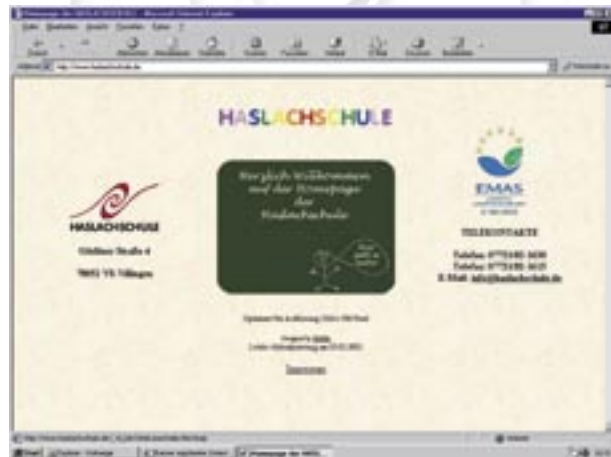
Figura 29 - Sito web di una scuola registrata

Altri esempi e riferimenti utili sono disponibili sul sito web europeo ( www.europa.eu.int/comm/environment/emas/index.htm ) nel quale è possibile consultare e stampare interessanti Linee guida sull'argomento corredate di foto e