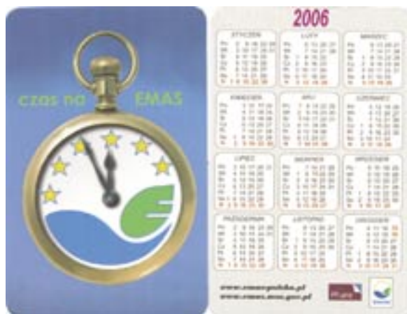
Figura 6 - Utilizzo del logo per scopi promozionali (gadget)

La figura 6 rappresenta un esempio di tale applicazione: un