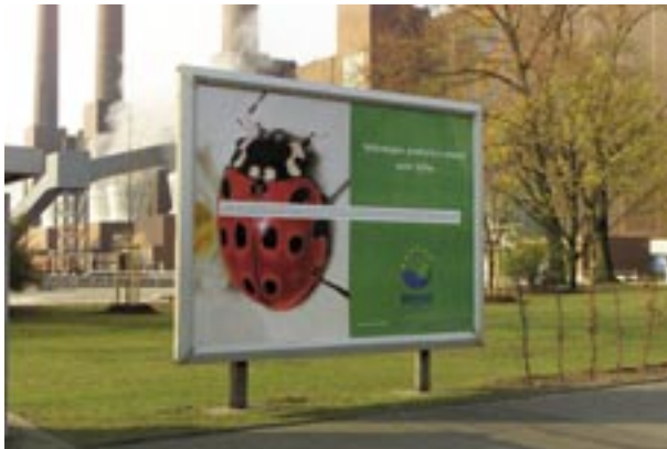
Figura 26 - Cartellone che pubblicizza il maggiolino Volkswagen