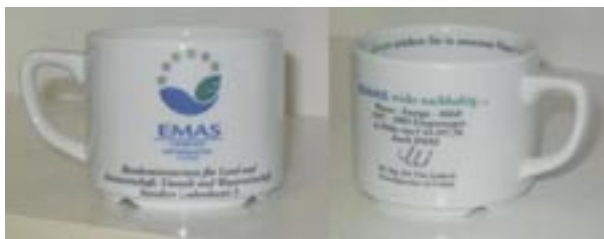
Figura 16 - Utilizzo del logo per informazioni convalidate

L'organizzazione può decidere di utilizzare vari canali di comunicazione per pubblicizzare l'avvenuta registrazione ed indirizzare messaggi recanti informazioni sulle proprie prestazioni ambientali. In genere, oltre alla dichiarazione ambientale, vengono diffusi opuscoli informativi, brochures, schede illustrative, annunci sulla stampa e TV, internet e inseriti nelle pubblicazioni aziendali dedicate all'ambiente. La figura 16 si riferisce a materiale informativo: un gadget riporta una serie di informazioni relative alle prestazioni ambientali del Ministero per l'ambiente Austriaco con la convalida (a destra) del verificatore.