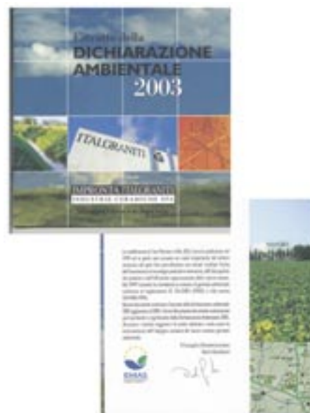
Figura 15 - Logo sull'estratto della dichiarazione ambientale della Italgraniti

Una disposizione del Regolamento del logo EMAS prevede che un'organizzazione registrata possa comunicare in modo mirato con particolari portatori d'interesse utilizzando parti della dichiarazione ambientale oppure altre informazioni che ritiene opportuno divulgare. Se l'organizzazione desidera associarvi anche il logo EMAS, essa è tenuta a farsi convalidare il testo del messaggio dal verificatore ambientale. In questo caso dovrà essere utilizzata la versione 2 del logo. In figura 15 è mostrata una sintesi di una dichiarazione ambientale appartenente ad una azienda del settore ceramico. Dall'originale documento, elaborato più con l'intenzione di comunicare i dati ambientali alle autorità che al pubblico