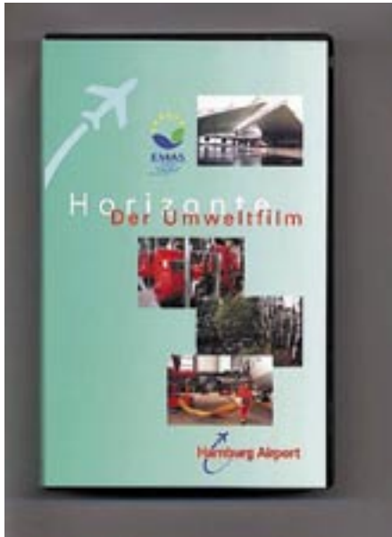
Figura 25 - Video relativo alle informazioni ambientali dell'aeroporto di Amburgo (D)

a carattere territoriale, quali i comuni, le aree turistiche, le aree naturali, i parchi e le aree archeologiche nelle quali l'applicazione di EMAS richiede anche un processo capillare di coinvolgimento dei cittadini e dei soggetti pubblici e privati le cui attività sono esercitate all'interno del territorio di competenza dell'entità che chiede la registrazione.