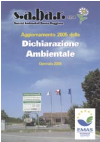
Figura 13 - Logo sul frontespizio di una dichiarazione ambientale

mare le organizzazioni, contestualmente alla comunicazione della avvenuta registrazione e dell'assegnazione del relativo numero di registro, sull'uso del logo fornendo anche le indicazioni sulla relativa specifica tecnica e sul formato elettronico messo a disposizione sul sito web dell'APAT. Oggi quasi il 100% delle dichiarazioni ambientali riporta il logo nella forma corretta nella copertina anteriore. La figura 14 rappresenta un caso forse unico in Europa per