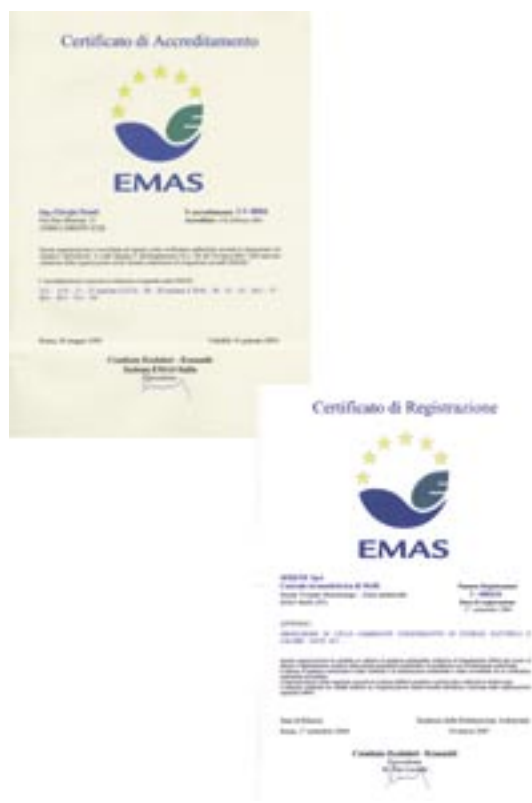
Figura 11 - Uso del logo sui certificati di accreditamento e registrazione

Un'altra dimostrazione di uso del logo nella versione 3 ci proviene ancora dal Comitato Ecolabel Ecoaudit che, come si vede nella figura 11 , mette in evidenza il logo nei certificati che vengono rilasciati alle organizzazioni registrate EMAS e ai verificatori ambientali che ottengono l'accreditamento per operare ai sensi del Regolamento EMAS.