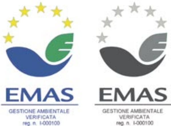
Figura 2 - Logo versione 1 a colori e bianco e nero

Il Regolamento indica due versioni per il logo (figure 2 e 3) e ne specifica il campo di applicazione.