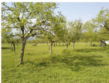
Scorcio del parco eco-archeologico di Pontecagnano Faiano

Segreteria organizzativa Tel./Fax: 089/383202 @-mail: cea@occhiverdi.org