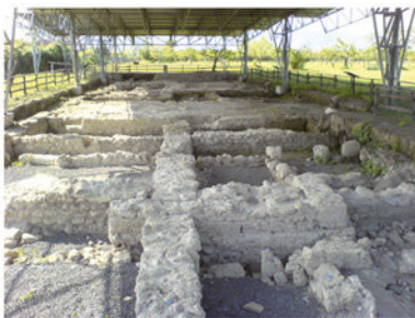
Scavi del parco eco-archeologico di Pontecagnano Faiano

Il Centro di Educazione Ambientale (C.E.A.) "Parco Eco-Archeologico" di Pontecagnano Faiano, gestito da Legambiente, fa parte della rete dei Centri di Educazione Ambientale previsti dal Programma Regionale "Informazione, Formazione ed Educazione Ambientale" (IN.F.E.A.). Svolge attività in favore delle scuole ed in generale dei cittadini di tutte le età attraverso percorsi di educazione ambientale che interessano anche le specificità dell'area archeologica. Il C.E.A. si presenta come un vero e proprio mediatore culturale tra scuola, società e territorio offrendo percorsi, chiavi di lettura e metodologie educativo-formative avvalendosi delle molteplici suggestioni presenti nell'ambito del Parco Eco-Archeologico di Pontecagnano Faiano.