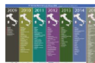
Iniziative nazionali dal 2009 al 2015

L'Edizione 2015 ha ricevuto il patrocinio del Consiglio Nazionale dei Geologi (CNG) e dei Servizi Geologici Nazionali Europei (EuroGeoSurveys). L'evento è stato, inoltre, inserito nell'ambito delle iniziative della Giornata Europea dei Minerali (EMD), della Giornata del Turismo Geologico (G&T Day) e dell'Anno Industriale tecnico europeo (E-Fair): l'inserimento in contesti europei e, in particolare, la sinergia con la Giornata Europea dei Minerali, ne ha favorito la diffusione anche fuori dal territorio Nazionale.