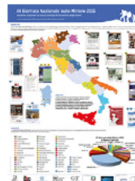
Poster VII Giornata nazionale sulle miniere 2015

L'Edizione 2015 ha ricevuto il patrocinio del Consiglio Nazionale dei Geologi (CNG) e dei Servizi Geologici Nazionali Europei (EuroGeoSurveys). L'evento è stato, inoltre, inserito nell'ambito delle iniziative della Giornata Europea dei Minerali (EMD), della Giornata del Turismo Geologico (G&T Day) e dell'Anno Industriale tecnico europeo (E-Fair): l'inserimento in contesti europei e, in particolare, la sinergia con la Giornata Europea dei Minerali, ne ha favorito la diffusione anche fuori dal territorio Nazionale.