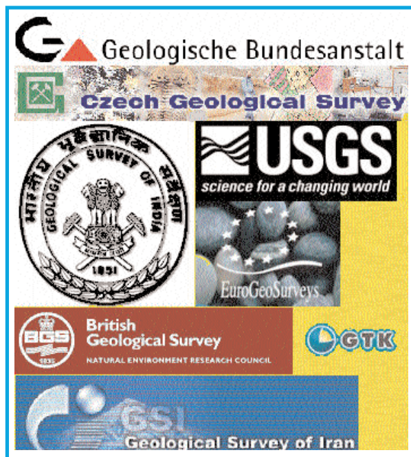
Fig. 1 - I logo di alcuni Servizi Geologici del mondo. - Geological Surveys logos.

Questo lavoro ha infine prodotto una lista di indirizzi di più di 120 Organizzazioni (fig. 1) che agiscono nei propri paesi come Servizio Geologico Nazionale. In alcuni casi, ove tali organizzazioni esistevano, la lista è stata completata con i Servizi Geologici regionali o locali.