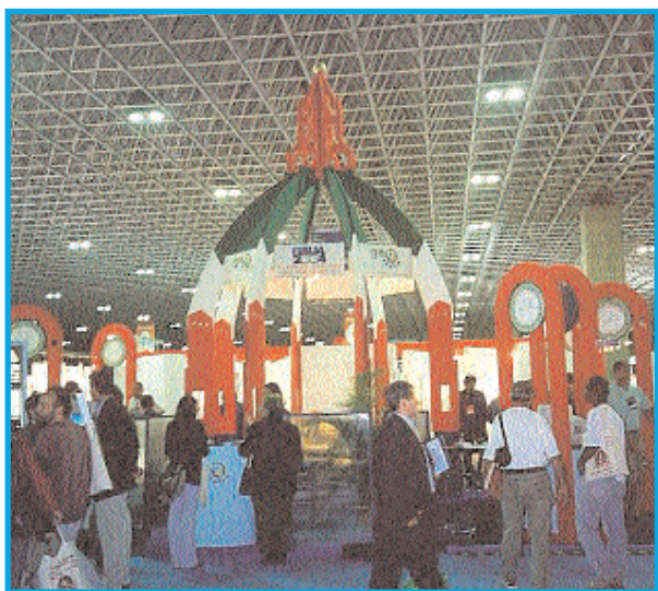
Fig. 1 - Stand Geoitalia durante la GeoExpo di Rio de Janeiro (2000). - Geoitalia stand in Rio de Janeiro GeoExpo (2000).

Dipartimento di Scienze della Terra, Università degli Studi di Firenze.