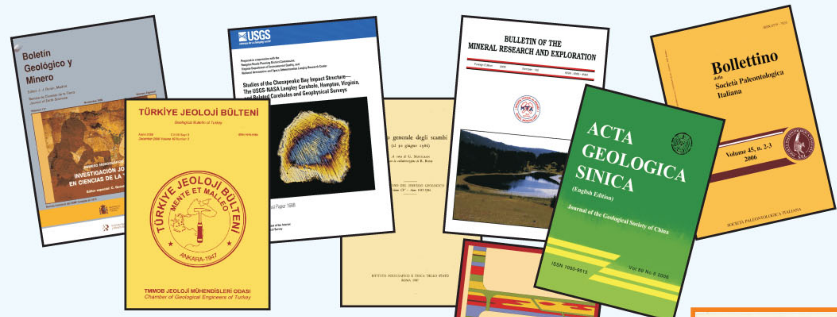
Figura 1 - Esempi di periodici in scambio

Alcuni esempi di periodici in scambio sono visibili nella figura 1. Per le carte si rimanda alla figura 2, nella quale si è evidenziata la dicitura "Pubblicazione inviata in cambio dal Dipartimento di Scienze della Terra - Università di Torino". Il quadro complessivo delle attività di scambio è schematizzato nelle tabelle 3, 4, 5 e 6, che riportano il numero degli enti in scambio rispettivamente nel 1957, 1986, 1989 e 2007, suddivisi in Europa, Asia, Africa, America settentrionale, America centrale, America meridionale e Oceania, con l'indicazione dei relativi paesi. La figura 3 mostra la distribuzione degli enti in scambio relativa al 1989 (tabella 5).