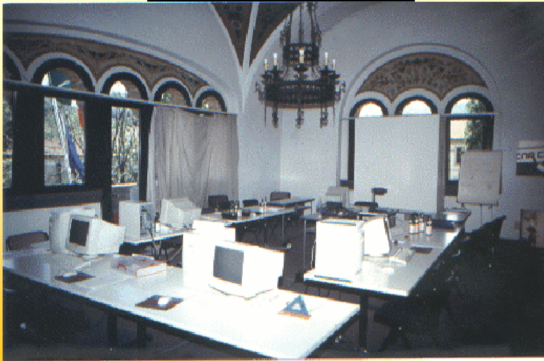
Aula di Informatica territoriale