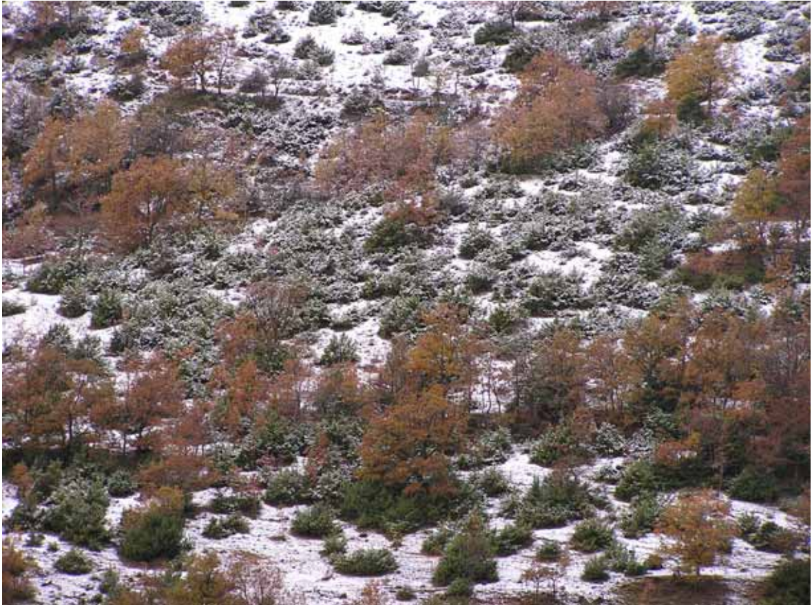
Fig.4 Esempolari sparsi di roverella (Cod. 41.732) compresi all'interno di un arbusteto a prevalenza di ginepri (Cod. 31.844). Località S.M in Valle Porclaneta, versante SW del Massiccio del Velino