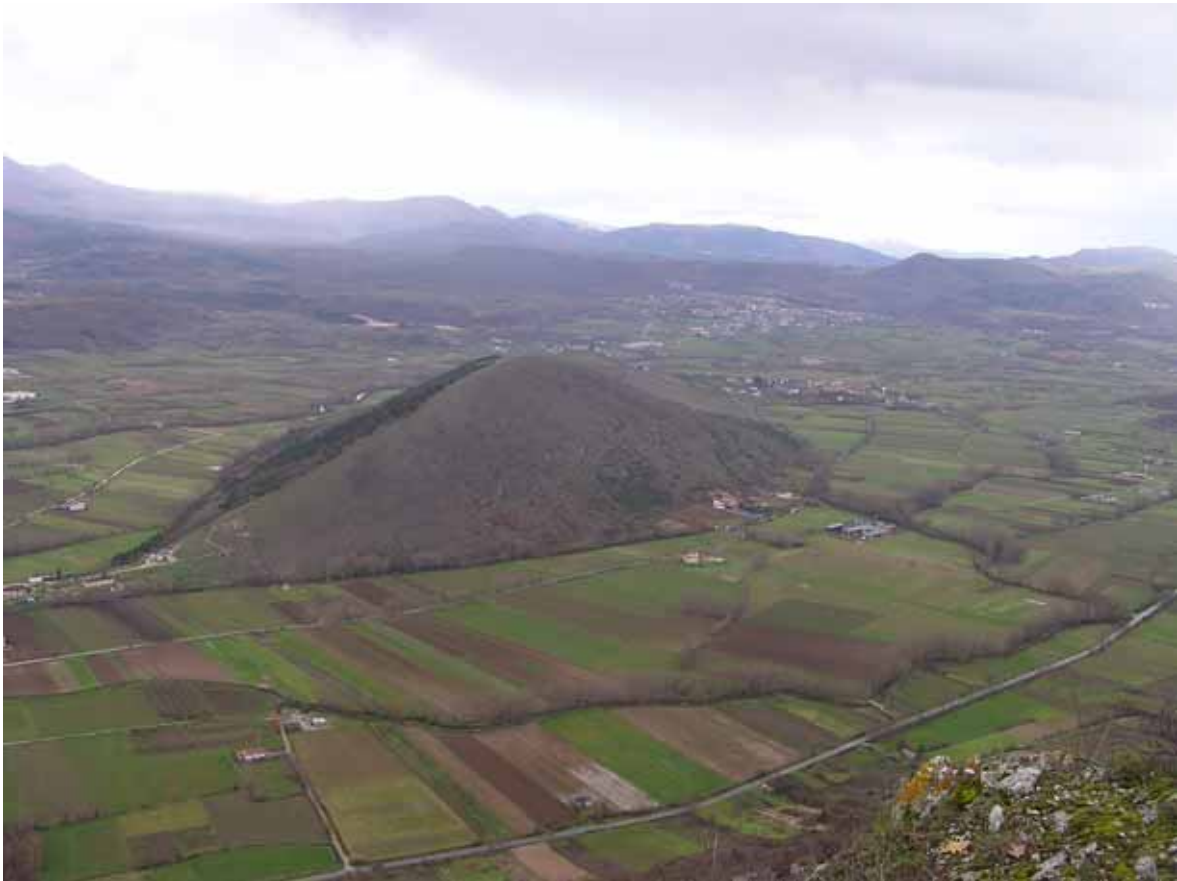
Fig.3 Culture di tipo estensivo e sistemi agricoli complessi (Cod. 82.3) con vegetazione ripariale (Cod. 44.13) nella Piana del Fiume Aterno (SE L'Aquila). In evidenza il Monte di Cerro, ricoperto prevalentemente da Praterie xeriche del piano collinare, dominate da Brachypodium rupestre , B caespitosum (Cod. 34.323). Presenti lembi di Piantagioni di conifere (Cod. 83.31)

Inoltre, trovandosi su suoli primitivi, sono stati distinti tramite modello dal 34.326 (Praterie mesiche del piano collinare) nel seguente modo: troviamo il 34.323 su suoli calcarei a pendenze maggiori di 15° (a pendenze minori è 34.326), mentre su terrigeni a pendenze maggiori di 30° è 34.323 (a pendenze minori di 30° è 34.326).