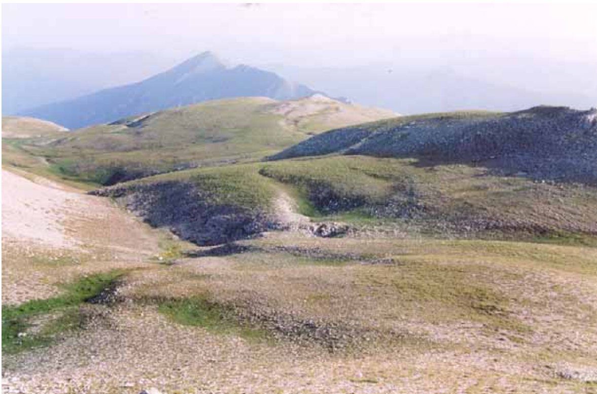
Fig.2 Praterie discontinue e scorticate dell'Appennino (cod. 36.436) Località Femmina Morta, Parco Nazionale della Majella