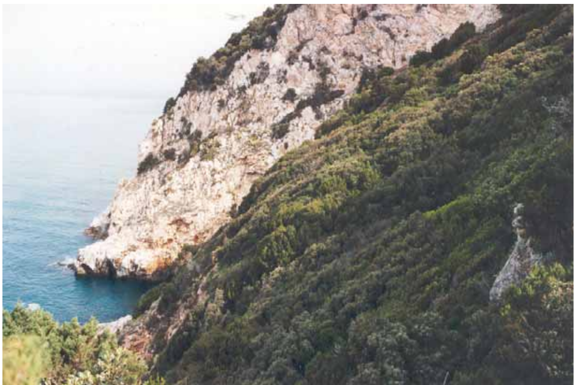
Fig.5 Leccete dell'Italia centrale e settentrionale (Cod. 45.318) e sullo sfondo Rupi mediterranee (Cod. 62.11) in località "Il Precipizio", Promontorio del Circeo

Presso il litorale di Terracina, nel Lazio, sono presenti pareti verticali calcaree prospicienti il mare (Fig.5 ). Tali condizioni edafo-xerofile favoriscono la diffusione della macchia mediterranea e di specie tipicamente rupicole (AA.VV., 1996). Poligoni sono stati digitalizzati ex novo con riscontro video da ortofoto.