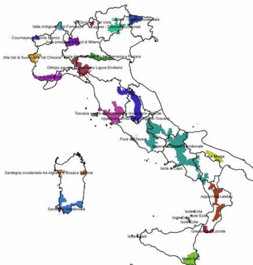
Fig. 1 Distribuzione delle aree test dei 6 milioni di ettari in Italia

La base concettuale e metodologica da prendere come riferimento per il progetto Carta della Natura è stata sperimentata in uno studio del 1993 condotto dall'Università degli Studi di Parma per il Ministero dell'Ambiente nell'Isola di Salina (Rossi, Zurlini, 1993). Su queste basi fu successivamente avviata la realizzazione Carta della Natura per 1 milione di ettari del territorio italiano su aree "tipologicamente" diverse per caratteri fisiografici e paesaggistici. Furono così individuate aree dell'Arco Alpino, dell'Arco Appenninico ed anche aree dai caratteri più mediterranei della Basilicata e dell'Aspromonte. Successivamente la Carta degli habitat e le relative valutazioni sono state realizzate su altri 6 milioni di ettari del territorio italiano (Fig.1), con una metodologia ulteriormente affinata e approfondita. Queste carte sono oggi in fase di revisione alla luce dell'aggiornamento della legenda realizzata successivamente.