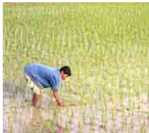
Figura 5: Irrigazione per sommersione