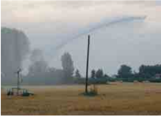
Figura 6: Irrigazione per aspersione