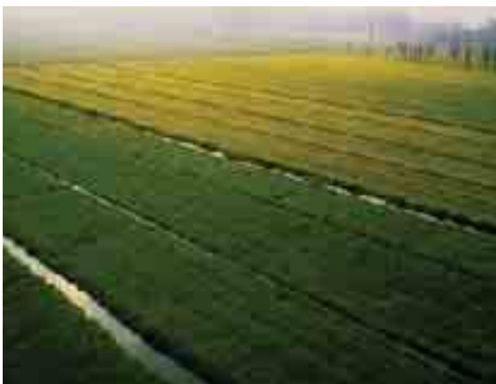
Figura 4: Irrigazione per scorrimento

ma non ha mai dato agli agricoltori indicazioni su quali metodi di irrigazione sostenibili utilizzare e non ha ancora sviluppato una politica di incentivi verso quelle aziende che si indirizzano alla microirrigazione.