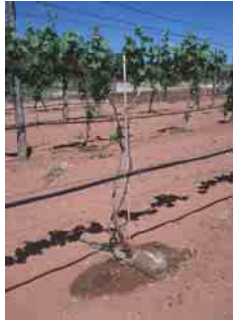
Figura 7: Irrigazione a goccia