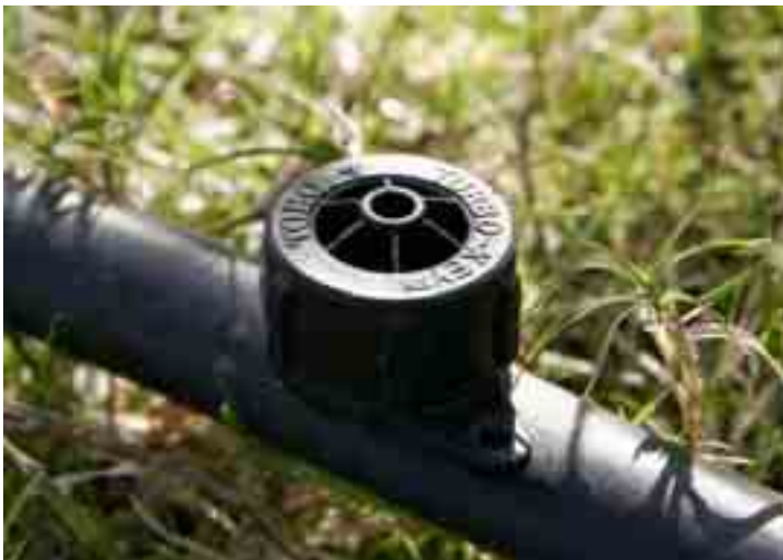
Figura 8: Gocciolatore