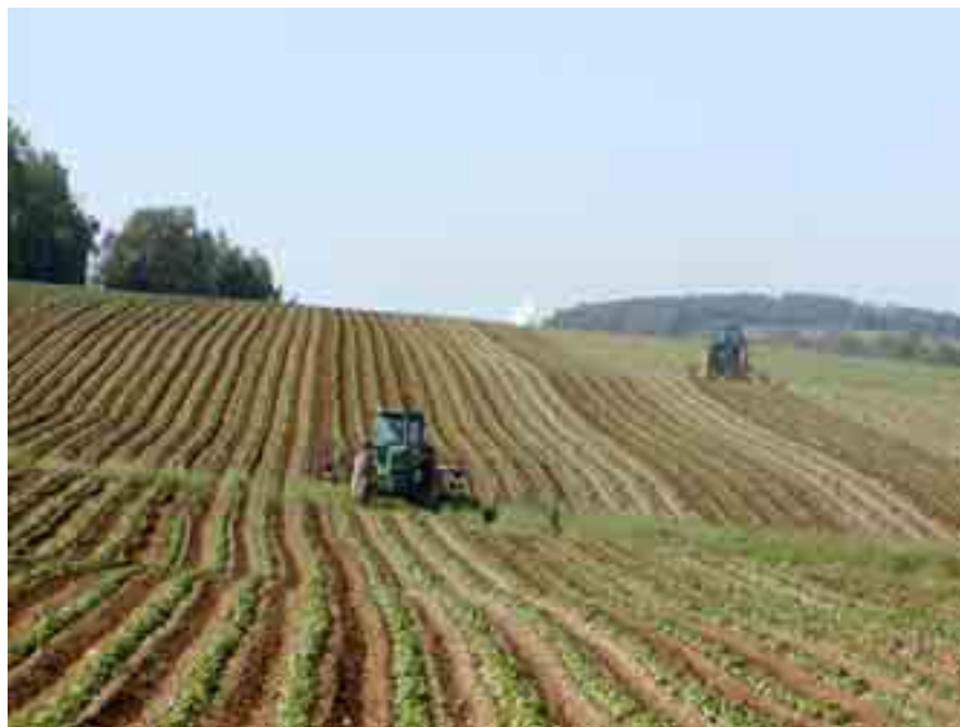
Figura 3: Monocoltura di patate