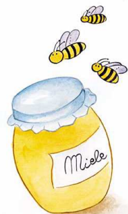
B) Il miele è pronto per essere gustato!