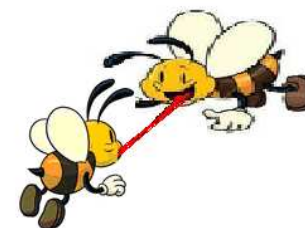
G) la trofallassi

INDIVIDUA LA SEQUENZA CORRETTA DELLE ATTIVITÀ: