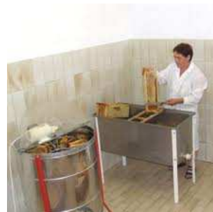
C) la smelatura