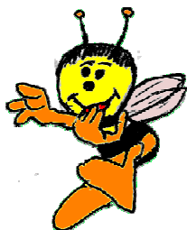
E) danza dell'ape esploratrice