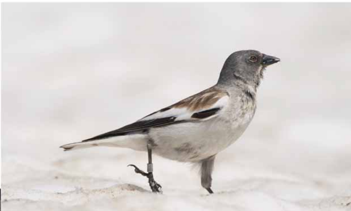
Fringuello alpino ( Montifringilla nivalis )