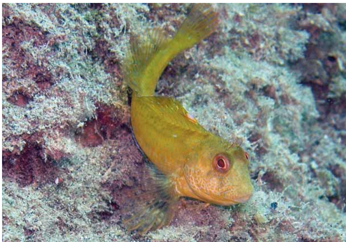
Bavosa (LEONARDO TUNESI/ISPRA)