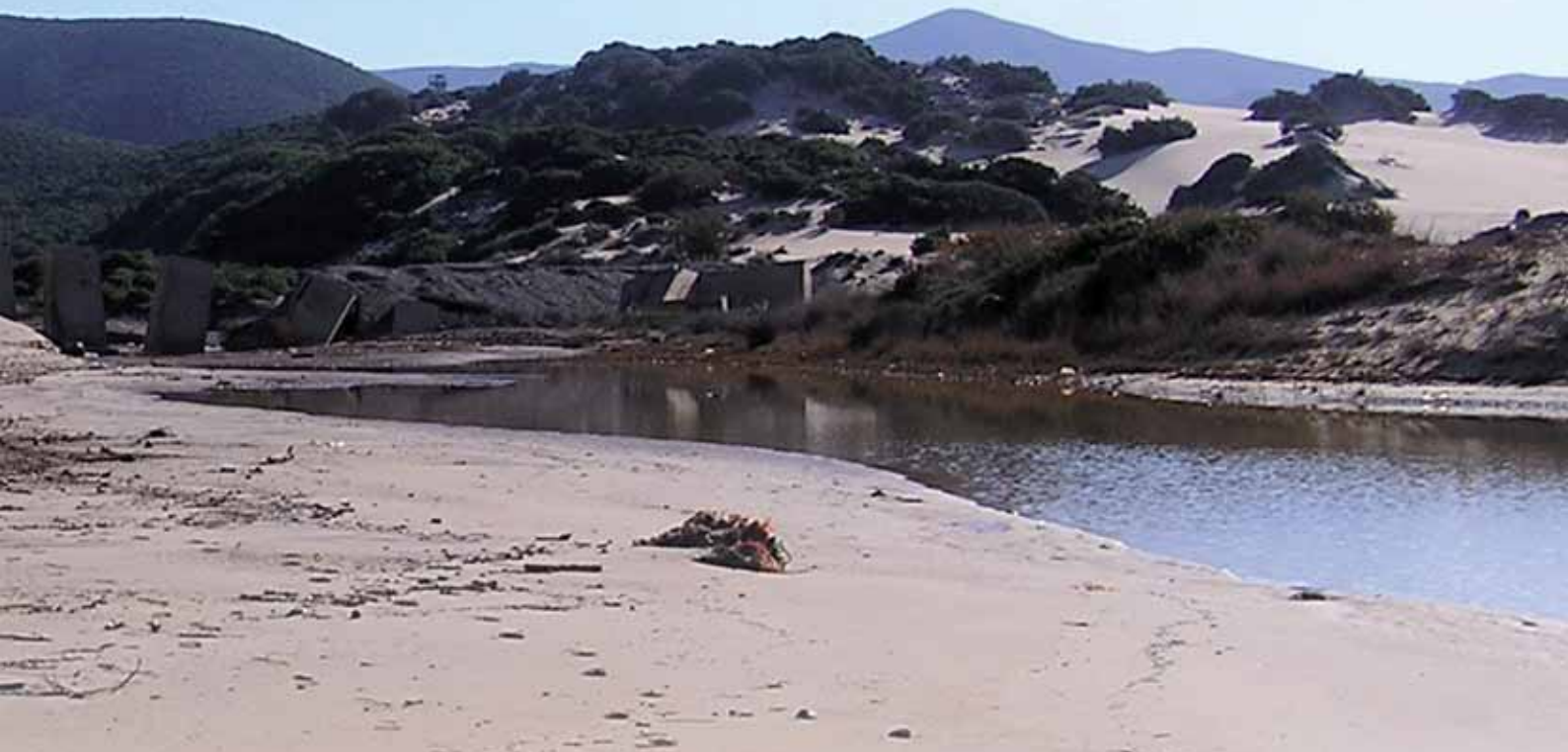
Dune. Foce Rio Piscinas. Sardegna

pressioni antropiche. L'80% della superficie delle dune costiere italiane è, infatti, andata persa nell'ultimo secolo. Il Repertorio nazionale degli interventi di ripristino degli ecosistemi marino-costieri nelle Aree Protette è un progetto i cui risultati sono contenuti nel Rapporto ISPRA 100/2009. Nel suo ambito è stata realizzata una banca dati ( http://www.isprambiente.it/media/dune_costiere.zip ), strumento operativo utile nelle opere di risanamento e rinaturazione degli ambienti dunali, che fornisce, per differenti tipologie di intervento, suggerimenti per l'utilizzo preferenziale di piante autoctone, riferibili alla locale vegetazione naturale potenziale, sulla base della loro efficienza registrata in analoghe esperienze.