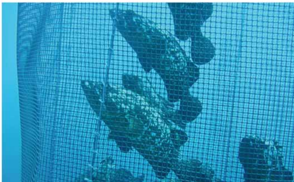
Rilascio di cernie riprodotte in cattività nelle acque di San Vito Lo Capo