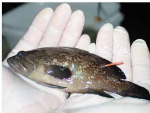
Giovanile di cernia riprodotto con tecniche d'acquacoltura

Accanto all'aspetto produttivo, l'interesse per l'acquacoltura dell'Istituto, prima come ICRAM e oggi come ISPRA, è motivato dal ruolo che l'acquacoltura ha anche nella gestione delle risorse acquatiche e per la conservazione della biodiversità. Esistono forme di acquacoltura estensiva, praticate nelle valli del Nord Adriatico, negli stagni sardi e nelle saline siciliane, interamente basate sull'uso delle risorse naturali, che hanno consentito di conservare ambienti acquatici naturali altrimenti destinati a bonifica. Sono sistemi produttivi estensivi, per lo più praticati con metodi tradizionali, che costituiscono un vero e proprio strumento di conservazione di zone umide sensibili di elevato valore naturalistico la cui valorizzazione rientra tra i principali obiettivi del progetto europeo SEACASE (Sustainable Extensive and Semi-intensive Coastal Aquaculture in Southern Europe) finanziato nell'ambito del VI Programma Quadro e che ha visto la partecipazione dell'ISPRA.