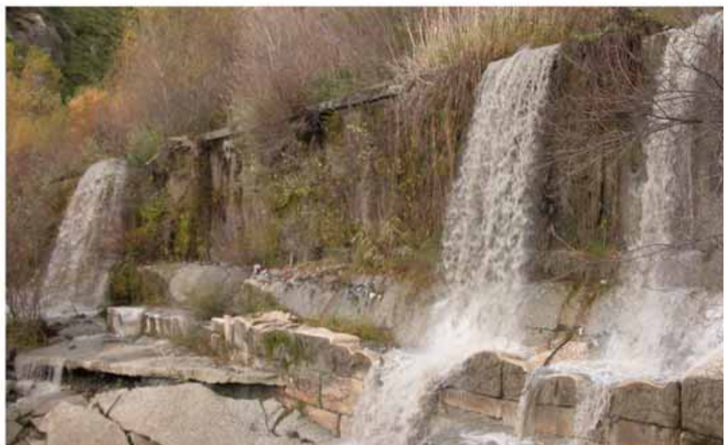
Particolare briglia in località Foresta