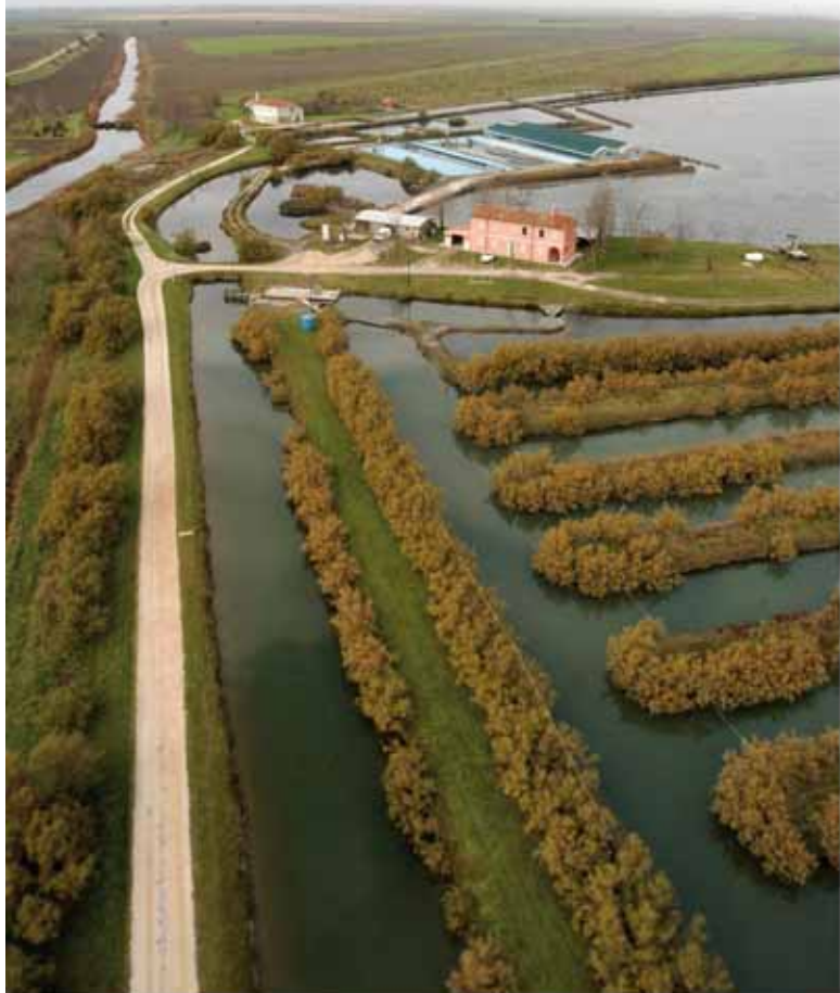
Produzione estensiva nelle valli venete

La messa a punto di tecniche di acquacoltura per molte specie marine e dulcaquicole ha aperto la strada a nuove forme di allevamento, la cui produzione è rappresentata da stock destinati al ripopolamento e alla reintroduzione di specie minacciate; da un lato per sostenere le attività di pesca e per compensare un basso reclutamento delle popolazioni selvatiche; dall'altro per il recupero di popolazioni acquatiche minacciate o localmente estinte. A livello internazionale, tra gli organismi che maggiormente hanno beneficiato di specifici programmi di conservazione e di recupero vi sono diverse specie di storioni inseriti nella Lista Rossa della IUCN ed alcune popolazioni di salmoni elencate nell'ESA, la convenzione americana per le specie minacciate.