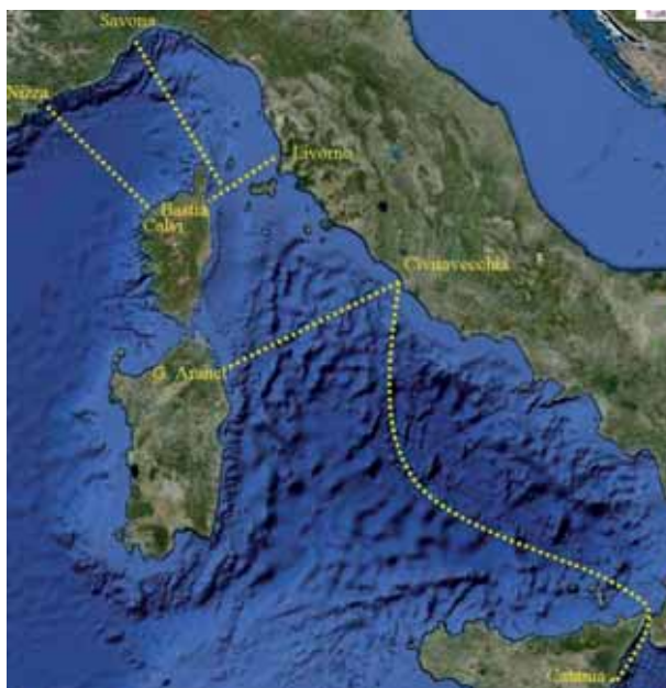
I 5 transetti fissi monitorati da ISPRA