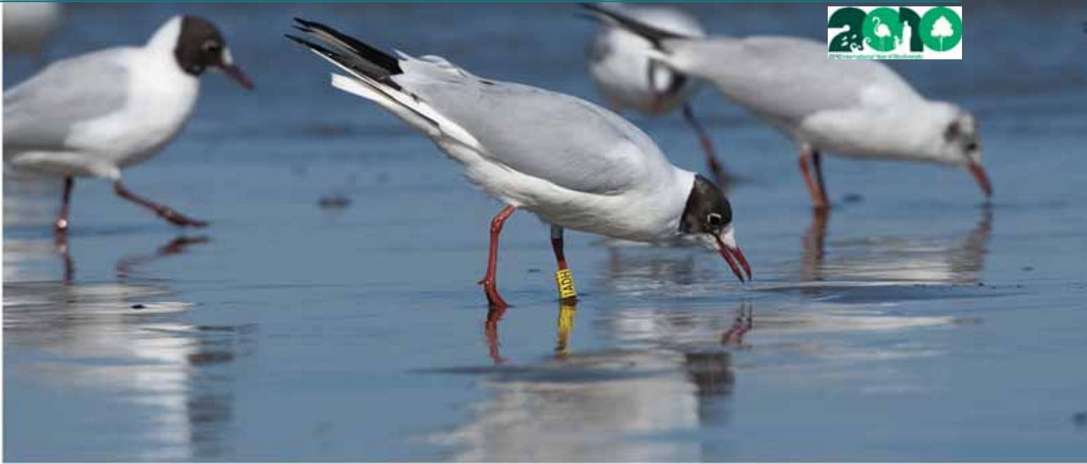
Gabbiano comune ( Larus ridibundus )

circa 260.000 dati relativi a più di 230 specie in media, insieme a più di 20.000 ricatture. La massa dei dati custoditi presso il CNI ISPRA viene gestita grazie al sistema informatico EPE (EURING Protocol Engine, presente sul portale www.isprambiente.it ). EPE assicura anche, tramite web, lo scambio delle informazioni su qualsiasi spostamento di uccelli inanellati e la condivisione delle stesse tra l'inanellatore che ha marcato l'animale, il/i segnalatore/i dello stesso, i Centri di inanellamento di Paesi di origine o destinazione degli uccelli inanellati. Inoltre EPE assicura la gestione di qualsiasi tipologia di dato di censimento quali, di recente, quelli in fase di acquisizione dall'Area Avifauna Migratrice tramite tecnologie innovative come i geo-localizzatori. Attraverso il CNI e numerose altre attività di validazione, in condizioni controllate di stabulazione, degli esiti dei monitoraggi, l'Area Avifauna Migratrice supporta le attività istituzionali dell'ISPRA per aspetti quali: basi scientifiche per l'applicazione di norme nazionali e comunitarie, rotte di migrazione e fenologia dei movimenti degli uccelli, uso dell'habitat e condizioni fisiche, ecologia della sosta, parametri demografici delle popolazioni nidificanti, effetti del mutamento climatico, piani d'azione per specie minacciate. A titolo di esempio il recente Atlante della Migrazione degli Uccelli in Italia, disponibile sul sito ISPRA.