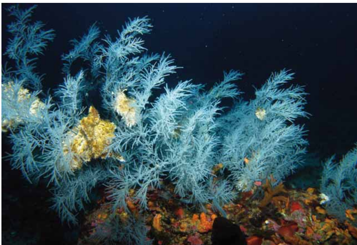
Corallo nero

sua biodiversità marina. Lo conferma la recente scoperta della più grande foresta italiana di corallo nero, tra cui quello rarissimo "Antipathes dicotoma" rilevato nel Golfo di Lamezia. Quali misure sono state e possono essere intraprese dall'Agenzia che lei rappresenta per limitare il fenomeno della perdita di biodiversità e tutelare invece questi tesori naturali?