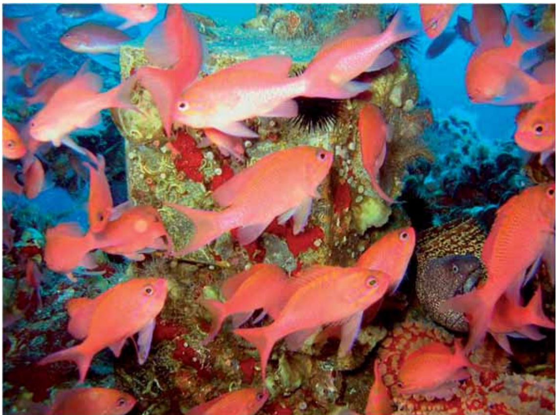
Fauna ittica (Anthias anthias e Muraena helena) associata alle piattaforme di estrazione (PIERPAOLO CONSOLI)