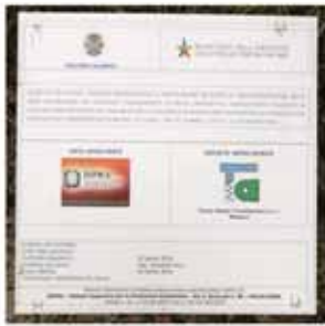
Cartello dei lavori