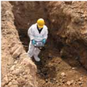
Misurazioni in campo