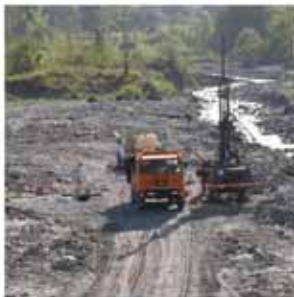
Sondaggio geologico

Proprio in funzione di quest'ultimo punto, le operazioni di scavo e campionamento sono state precedute da indagini preliminari volte ad assicurare l'incolumità dei lavoratori in campo (consistenti in indagini di spettrometria gamma in campo, effettuate dal Servizio Misure Radiometriche - Dipartimento Rischio Nucleare, Rischio Tecnologico e Industriale - dell'ISPRA e dall'ARPA Piemonte) e l'individuazione di masse metalliche o di rifiuti interrati nel sottosuolo di aree sospette tramite indagini geofisiche (indagini geoelettriche condotte dal Servizio Geofisica del Dipartimento Difesa del Suolo dell'ISPRA, indagini georadar a cura di una ditta privata ed indagini magnetometriche svolte da ARPA Calabria).