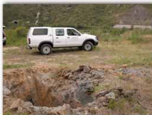
Mezzo ISPRA sul luogo