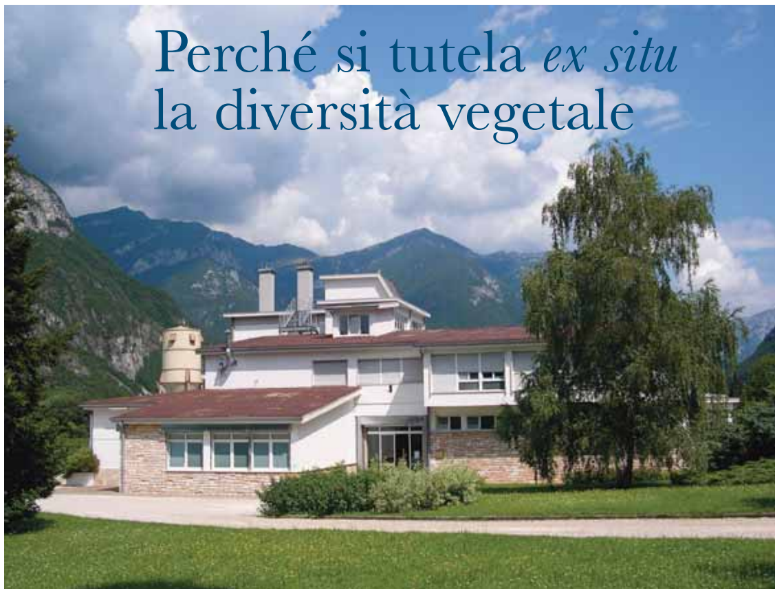
Centro nazionale per lo studio e la conservazione della biodiversità forestale. Peri, Verona (NICOLA MONTEBELLI)

La diversità biologica è stata da sempre principalmente tutelata in natura, cioè nel luogo dove naturalmente si trova (praterie, boschi, laghi, paludi, deserti, ecosistemi montani, ecc.), in questi casi si parla di conservazione in situ .