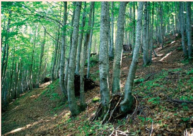
Faggeta - Monti della Laga

Il logo dell'evento mondiale evoca il tema "Foreste e popoli" celebrando la multifunzionalità delle foreste ed il ruolo centrale dell'uomo nella conservazione e nella gestione sostenibile e durevole delle foreste del pianeta. I diversi simboli rappresentano alcune delle innumerevoli funzioni delle foreste e la necessità di una visione ampia e complessa. Le foreste oltre a fornire legno, infatti offrono riparo agli uomini e habitat alla biodiversità, costituiscono una fondamentale risorsa alimentare, idrica e farmaceutica; svolgono un ruolo essenziale per la stabilità climatica e ambientale mondiale. Tutte le icone riunite sull'albero rinforzano il messaggio delle foreste come risorsa vitale per