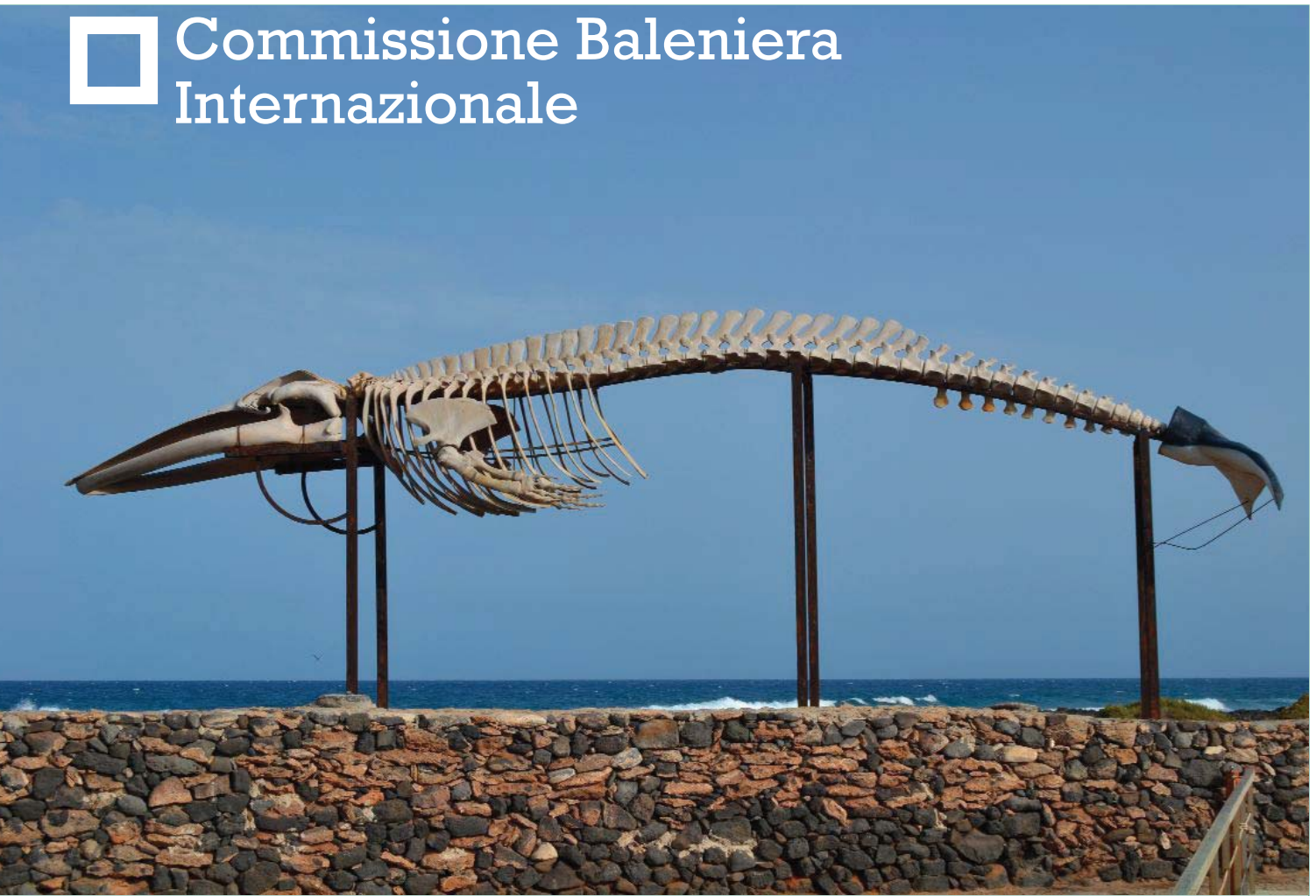
Scheletro di balena a Fuerteventura, Canarie

Dal 1946 la Commissione Baleniera Internazionale ( International Whaling Commission ) 1 si occupa della gestione delle popolazioni sottoposte alla caccia aborigena, ossia la caccia a sussistenza dei popoli indigeni, da parte di Stati Uniti, Groenlandia, San Vincent e le Granadine e Federazione russa, alla caccia commerciale (da parte di Norvegia e Islanda) e a quella cosiddetta "scientifica", condotta tuttora da parte del Giappone. Col passare degli anni l'orientamento originario della Convenzione da cui discende l'IWC, è cambiato: con una grande