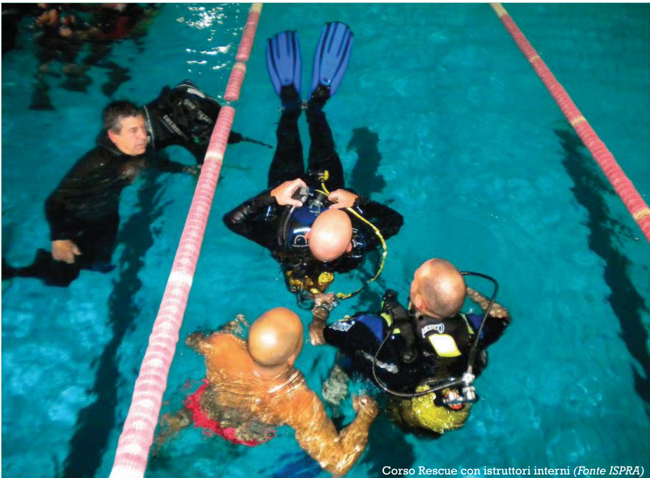
Corso Rescue con istruttori interni