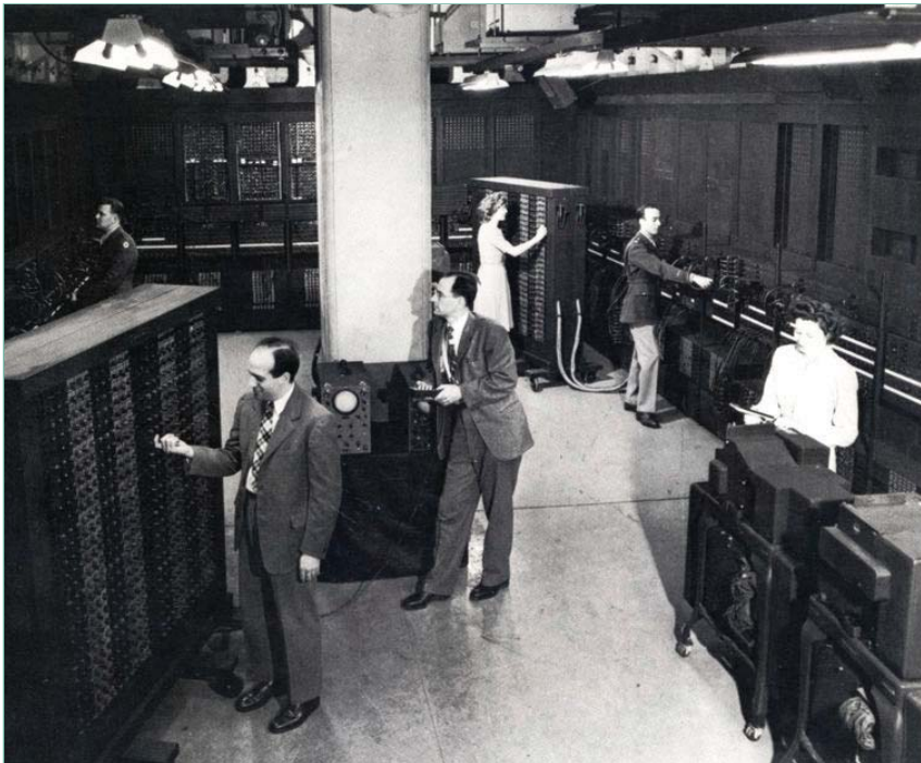
The ENIAC (Electronic Numerical Integrator and Computer)

nente le previsioni per i principali porti. All'inizio le tavole venivano faticosamente calcolate a mano, in seguito si costruirono dei complessi sistemi meccanici per fare i calcoli. Dagli anni sessanta, con l'avvento dei computer, la previsione di marea è diventata un fatto talmente alla portata di tutti da essere scontato e quasi dimenticato.