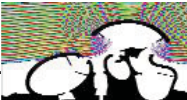
Grafico del risultato di un calcolo svolto mediante un modello ISPRA

I metodi numerici per la modellistica su larga scala (regionale o sub-regionale) riproducono i fenomeni di generazione (vento), propagazione, interazione con la costa (rifrazione e shoaling) e frangimento. Generalmente queste simulazioni vengono svolte con modelli di tipo spettrale, che ricostruiscono le caratteristiche parametriche (periodi, ampiezze, direzioni) delle onde. I programmi di calcolo con i quali vengono ottenuti questi risultati sono principalmente WAM e SWAN (disponibili liberamente in rete).