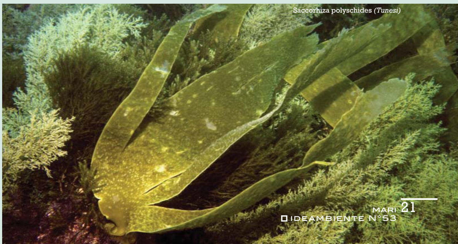
Saccorhiza polyschides (Tunesi)