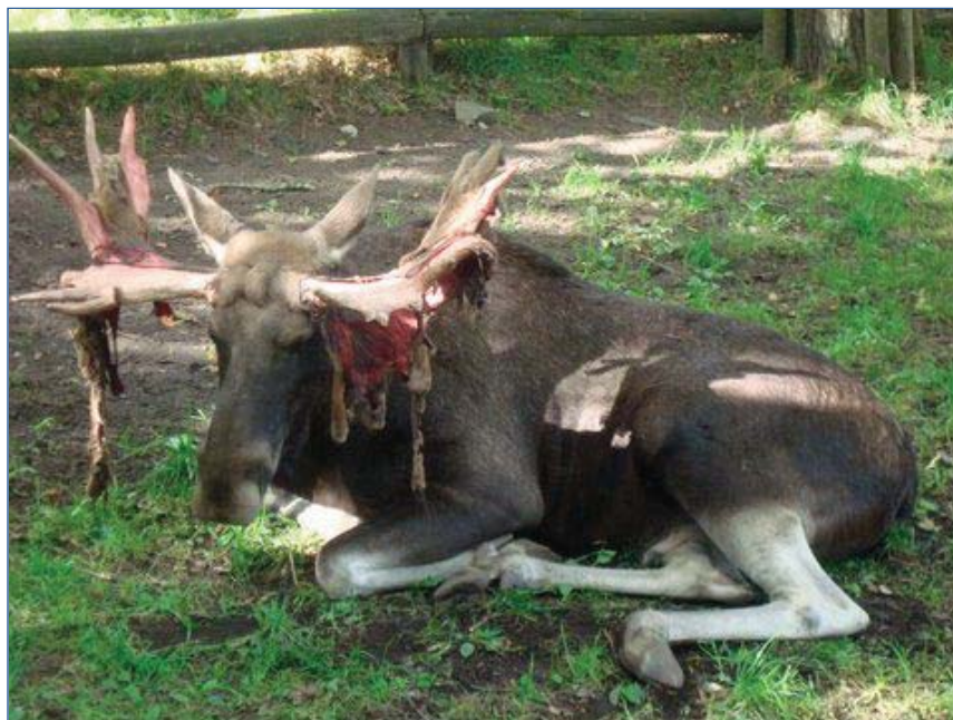
Parco di Skansen Stoccolma, Svezia