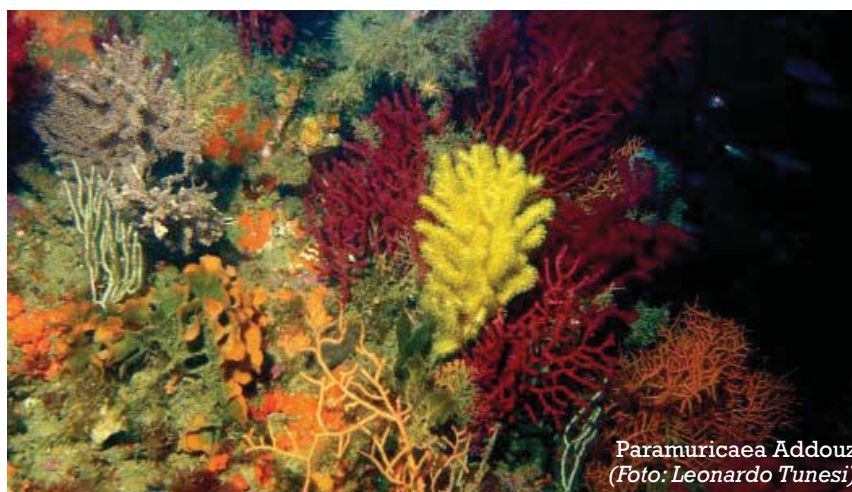
Paramuricea Addouzi