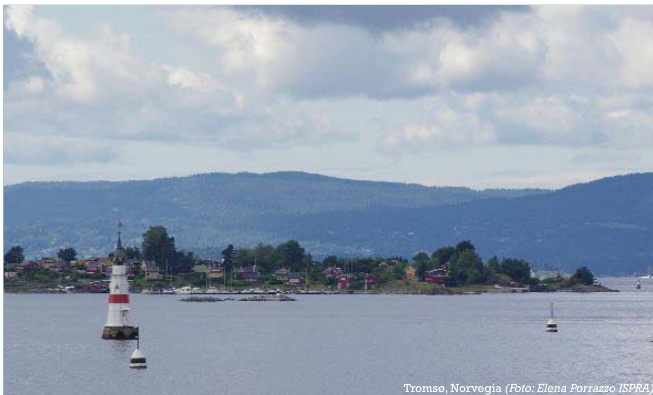
Tromsø, Norvegia