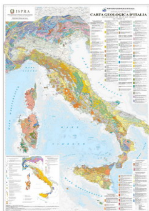
Figura 5 – L'ultima edizione della Carta Geologica d'Italia in scala 1:1.000.000, pubblicata dal Servizio Geologico d'Italia nel 2011 in occasione dei 150 anni dell'Unità d'Italia.