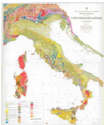
Figura 4 – La 4ª edizione della Carta Geologica d'Italia 1:1M, revisione della precedente edizione, curata da Enzo Beneo e pubblicata nel 1961.

Questo lavoro fu possibile perché, alla data di completamento della carta, iniziata nel 1926, il Regio Ufficio Geologico aveva prodotto 130 fogli della Carta Geologica d'Italia in scala 1:100.000, mentre di altri 50 fogli esistevano già le minute di rilevamento; erano state inoltre realizzate carte parziali o regionali a diversa scala, integrate nella realizzazione della carta con nuovi elementi provenienti da pubblicazioni e da studi inediti, comprendendo la parte transfrontaliera le cui informazioni derivarono dalla 2ª edizione della Carta Geologica della Francia al 1.000.000 di Michel-Levy del 1905, dalla carta Geologica della Svizzera al 500.000 di Heim e Schmidt del 1911 e da carte realizzate dall'Istituto Geologico di Vienna per il settore orientale.