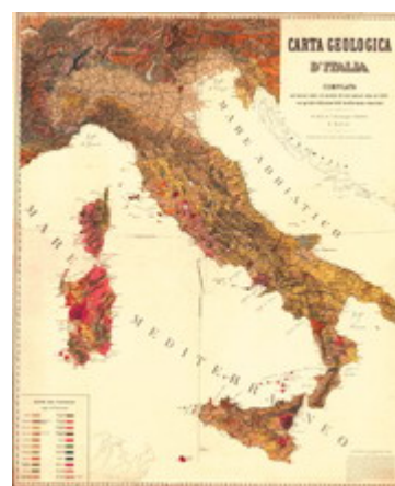
Figura 1 – La 1 a edizione della Carta Geologica d'Italia in scala 1:1.000.000, pubblicata nel 1881.

Una svolta decisiva viene data dalla costituzione del Regio Comitato Geologico, la conseguente pubblicazione di alcune carte geologiche "regionali" e l'avvio del Progetto di cartografia geologica in scala 1:100.000. Si cominciò quindi a lavorare alla 1 a edizione della Carta Geologica d'Italia in scala 1:1.000.000 (Fig. 1), che venne finalmente stampata nel 1881 in occasione del 2° Congresso Internazionale di Geologia di Bologna; curata dal Regio Ufficio Geologico, venne "compilata sui lavori editi ed inediti di vari autori fino al 1881".