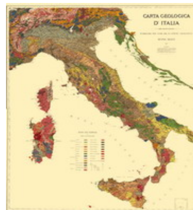
Figura 2 – La 2ª edizione della Carta d'Italia 1:1M del 1889, stampata in due fogli.

Nell'adunanza della Società Geologica tenutasi a Verona, De Stefani (1882) presentò una nota a commento della prima edizione della carta, mettendo in evidenza alcune interessanti osservazioni, dalle quali si partì per la realizzazione della successiva edizione. Infatti pochi anni dopo, nel 1889, soprattutto grazie ai notevoli progressi compiuti nel rilevamento geologico, venne pubblicata la 2ª edizione della Carta (Fig. 2), completamente aggiornata e che, come indicato nel frontespizio, venne "compilata in base ai rilevamenti eseguiti dagli Ing. del Reale Corpo delle Miniere e su lavori editi di geologi italiani e stranieri" . Commenti sfavorevoli a questa edizione vennero espressi ancora da De Stefani (1891), sempre molto critico nei confronti del Comitato Geologico, al quale attribuiva una eccessiva burocratizzazione e arretratezza dei metodi utilizzati per gli studi geologici; avanzò diverse osservazioni, alcune delle quali di ordine lessicale ed altre relative alla distinzione delle unità in legenda (ad es. la distinzione tra Gneiss centrale, Graniti e Sieniti). Si espresse invece a favore delle innovazioni introdotte nell'area alpina occidentale, nonostante si mostrasse poi molto conservativo rispetto all'attribuzione permiana degli Scisti cristallini affioranti in Sicilia e Calabria che, a suo dire, modificarono la precedente opinione di "quegli arcidotti scienziati che sono il Pareto e il Gastaldi" .