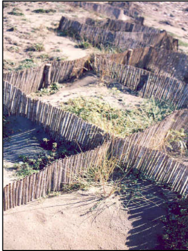
Schermi frangivento disposti a scacchiera, a circa 4 anni dalla loro realizzazione