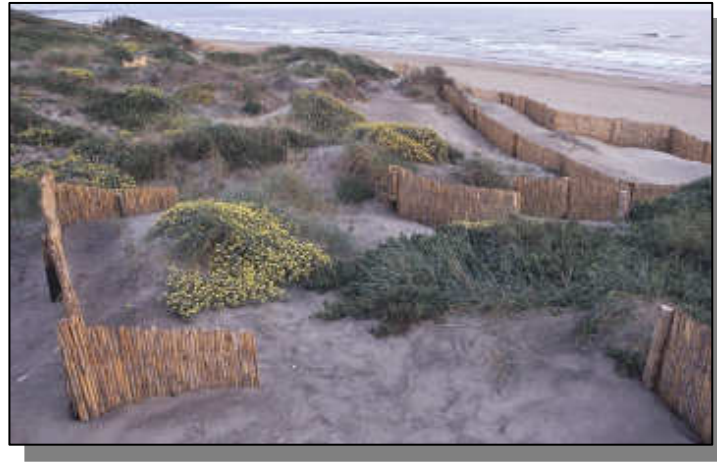
Barriera basale in viminata realizzata in prossimità della linea di riva