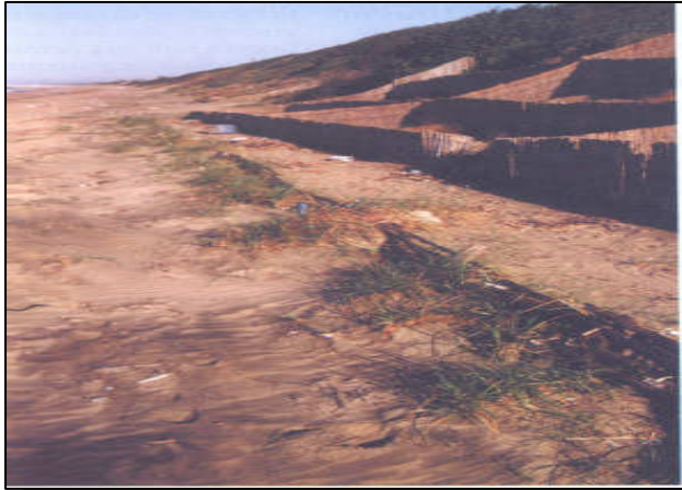
Barriera basale a 5 anni dalla realizzazione: evidenti sono la deposizione di sabbia e la formazione di una duna embrionale attorno alla barriera