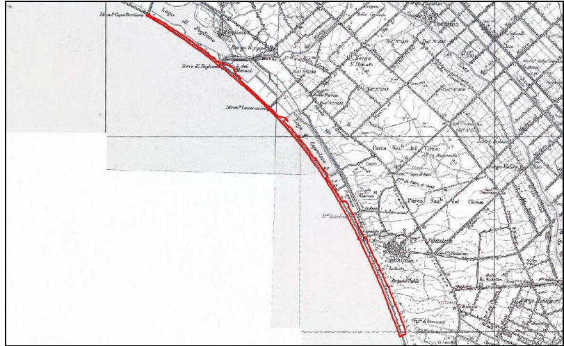
Cartografia del SIC "Dune del Circeo"

Il Soggetto proponente dell'intervento è l'Amministrazione comunale di Sabaudia.