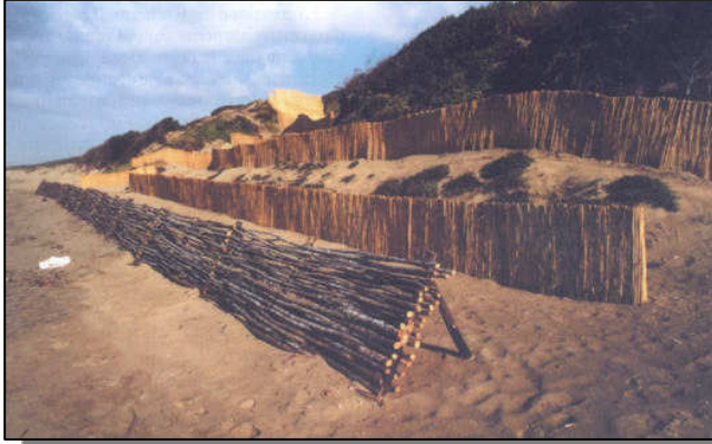
Barriera basale in viminata subito dopo la sua realizzazione