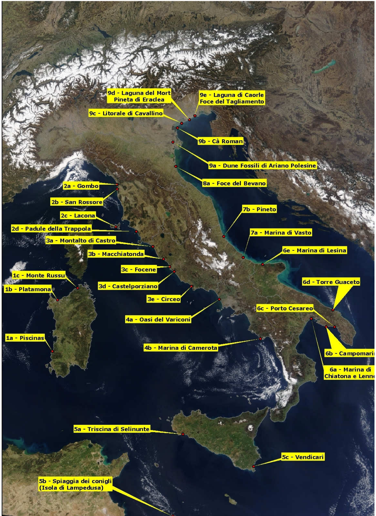
Mappa di tutti gli interventi censiti da ISPRA, al 2009 (Immagine elaborata da Massimo Paone e Valentina Piacentini)