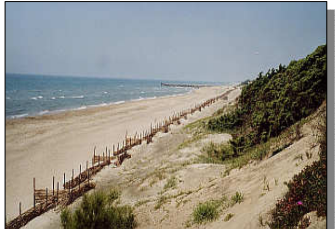
Opere di contenimento e consolidamento delle sabbie