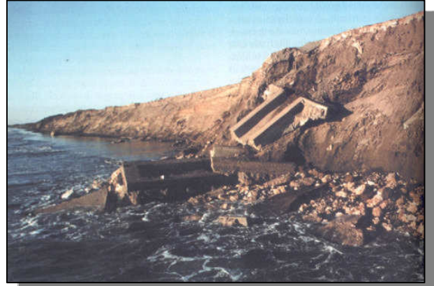
Effetti delle mareggiate degli anni '80, con demolizione parziale della duna e strada costiera