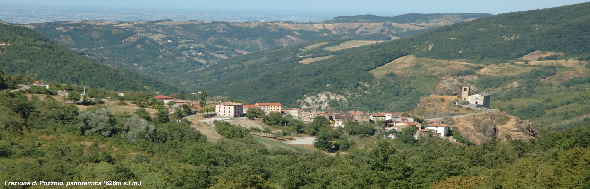
Frazione di Pozzolo, panoramica (626m s.l.m.)