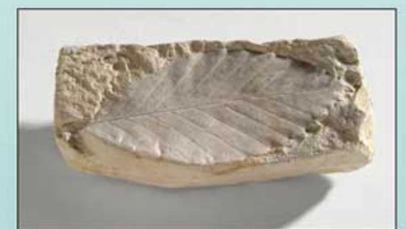
Fagus sp. N. inv. 15689 - Esempio della famiglia delle Fagaceae costituito da foglia ellittica lanceolata, con margini ondulati. Età: quaternario. Provenienza: Lazio.