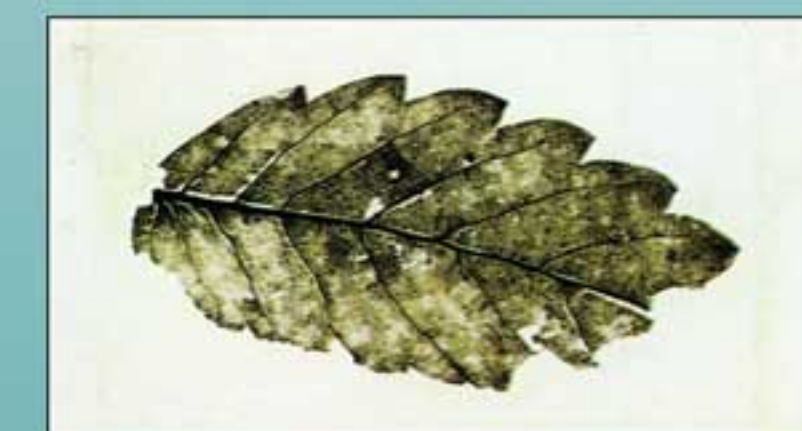
Foglia fossile di Zelkova crenata . E' un albero oggi scomparso dalla vegetazione italiana perché estinto durante l'ultima glaciazione.