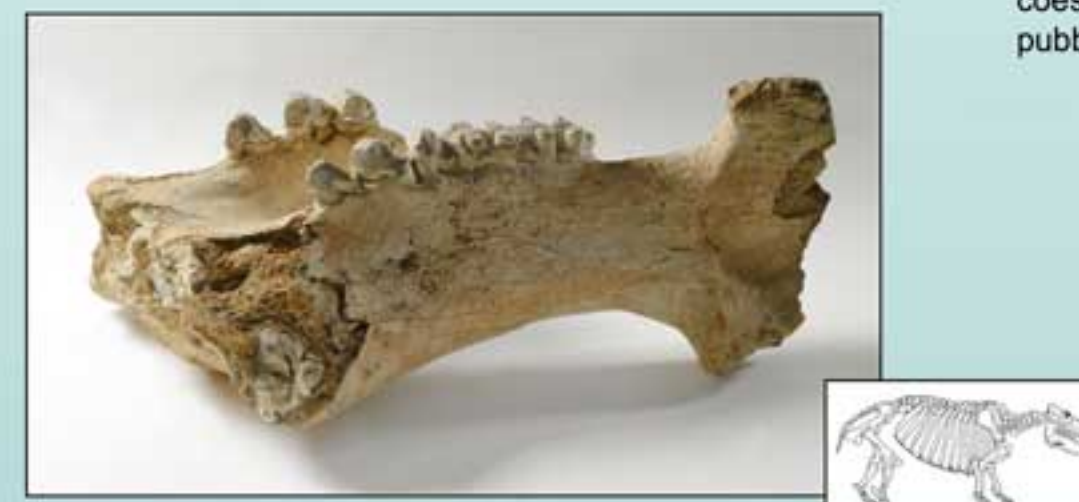
Hippopotamus amphibius N. Inv. 4449 - Mandibola di Ippopotamo incompleta, in buono stato di conservazione, rinvenuta a Canale di Malafede, nel territorio laziale. Risultano ben evidenti i denti della branca mandibolare sinistra mentre sono mancanti i denti anteriori dei quali si vede solo il punto di frattura. Età: Pleistocene Superiore.