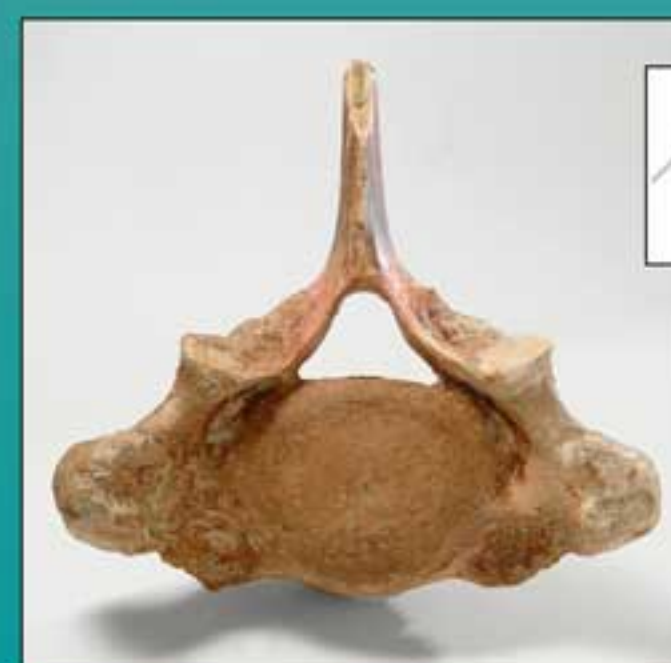
Elephas (Palaeoloxodon) antiquus N. Inv. 22310 - Vertebra dorsale di Elefante antico pressoché completa attribuito al Pleistocene Superiore. L'esemplare proviene da un livello tufaceo affiorante in località Malagrotta, presso Roma.