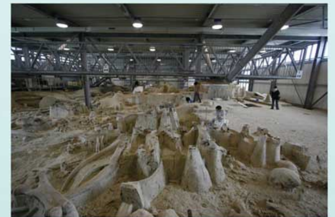
LA POLLEDRARA DI CECANIBBIO - Questo giacimento del Pleistocene medio-superiore, situato a Nord Ovest di Roma, è il giacimento con i resti di Elephas (Palaeoloxodon) antiquus più abbondanti e meglio conservati in Europa. In questo sito sono stati ritrovati anche abbondanti resti di bovini e di cervi, oltre che numerosi resti vegetali che testimoniano la loro coesistenza nello stesso ambiente di vita. Una parte degli scavi è aperta al pubblico e visitabile su prenotazione.