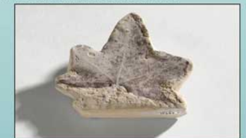
Acer pseudoplatanus N. inv. 15690 - Esempio della famiglia delle Aceraceae costituito da una foglia palmata a cinque lobi incisi. L'acero è ancora molto diffuso nell'Italia centrale. Nei dintorni di Roma ora vive al di sopra degli 800 m. Circa 100.000 anni or sono viveva al livello del mare: pertanto il clima di Roma era allora più freddo di quello attuale. Età: quaternario. Provenienza: Abruzzo.