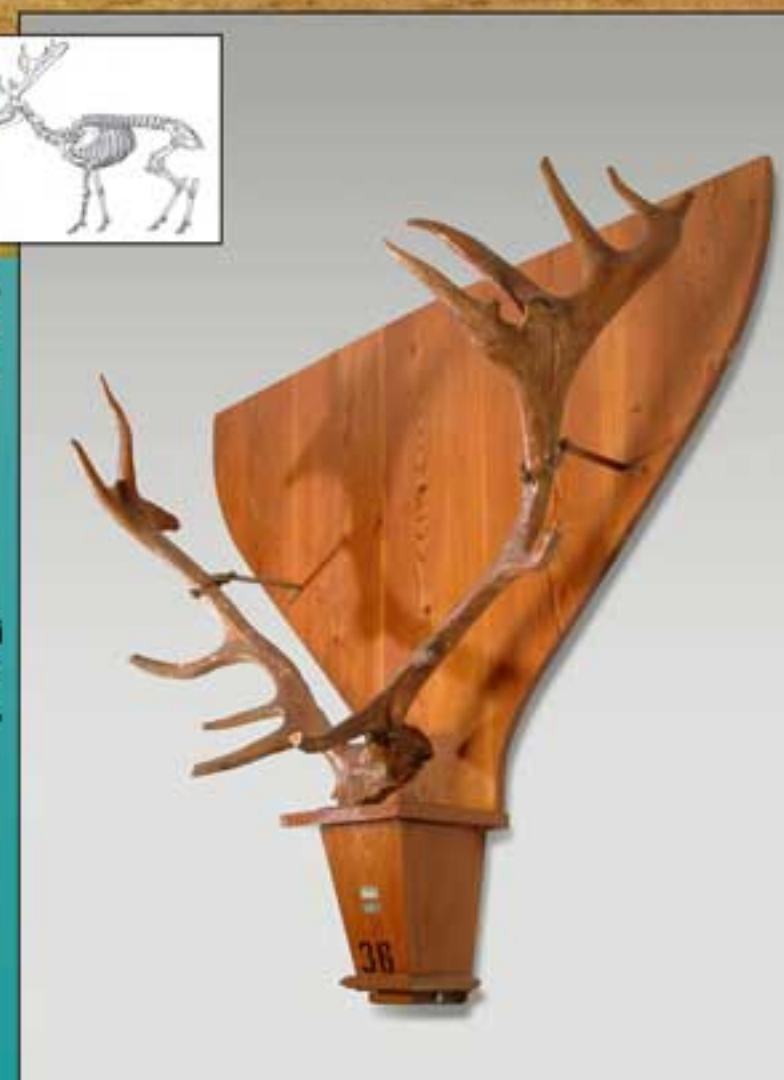
Cervus elaphus cf. aretinus N. Inv. 21775 - Cranio di cervo, comprensivo di palchi, del pleistocene superiore, raccolto nel 1936-37 negli affioramenti lignitiferi - argillosi di Quaranta lungo le rive del Chiana, in provincia di Arezzo.