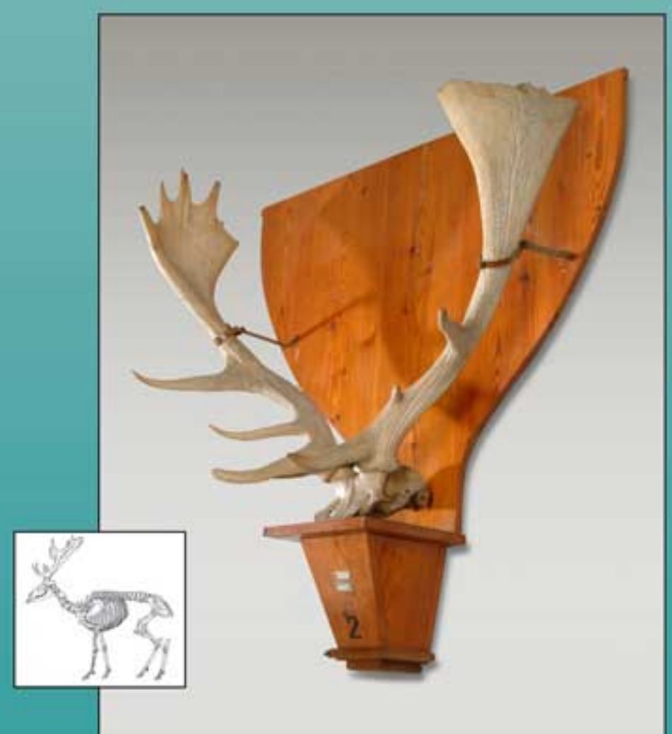
Cervus elaphus palmidactylocerus N. Inv. 21956 - Palco di cervo del Pleistocene superiore, impiantato sul cranio, raccolto nel 1936-37 negli affioramenti lignitiferi - argillosi di Quaranta, lungo le rive del Chiana, in provincia di Arezzo.