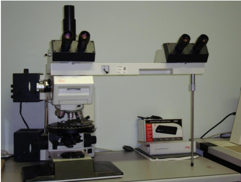
Microscopio polarizzatore Leika RXP