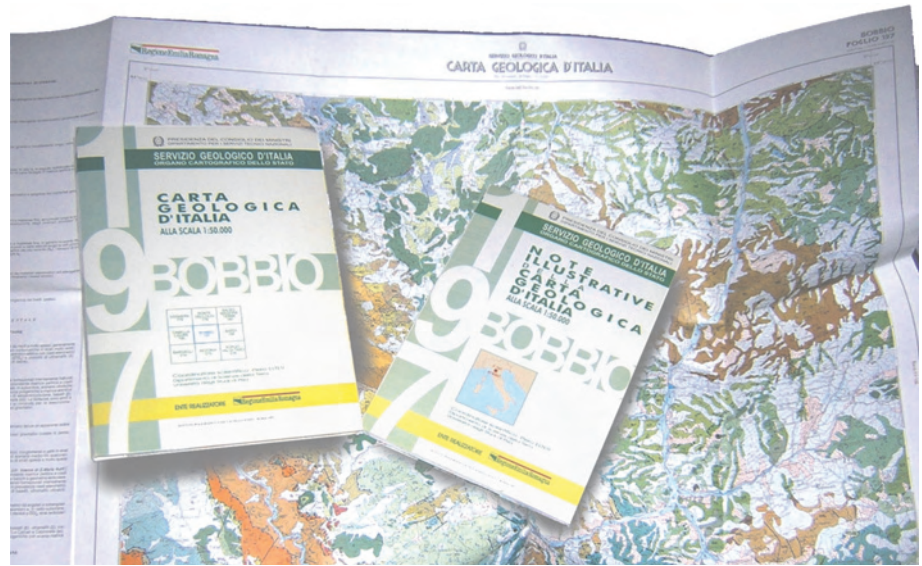
Fig. 3 - Il primo foglio CARG sperimentale, n. 197 “Bobbio” stampato nel 1996. - Reproduction of the first experimental C.A.R.G. sheet n. 197 Bobbio, printed in 1996.

Come si nota l’intera fase di evoluzione tecnologica di sistemi e metodologie di stampa è coinciso con l’affermarsi sempre più di procedure assistite da computer . Da qui la necessità di migrazione verso queste nuove tecniche peraltro, come rilevato nelle premesse, nello stesso senso della fornitura e conservazione numerica del dato geologico in una Banca Dati di settore da popolare man mano che i fogli geologici del progetto CARG pervengono alla definitiva consegna.