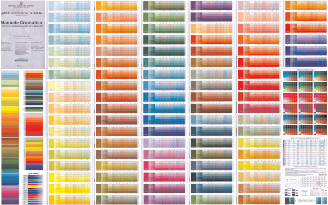
Fig. 5 - “Manuale Cromatico di riferimento per la stampa delle Carte Geologiche”, pubblicato nel 2001. - Color reference manual for the printing of geological maps, published in 2001.

dello Stato” quale il “Servizio Geologico d’Italia”. Le matrici su supporto metallico, in genere alluminio, sono direttamente incise da “ laser plot ” ad alta risoluzione pilotato dal file predisposto per la stampa o meglio dalla sua derivazione in ragione dei layer colore in esso presenti secondo le definizioni previste nel “Manuale Cromatico di riferimento per la stampa delle carte geologiche”, pubblicato nel 2001 (fig. 5) in