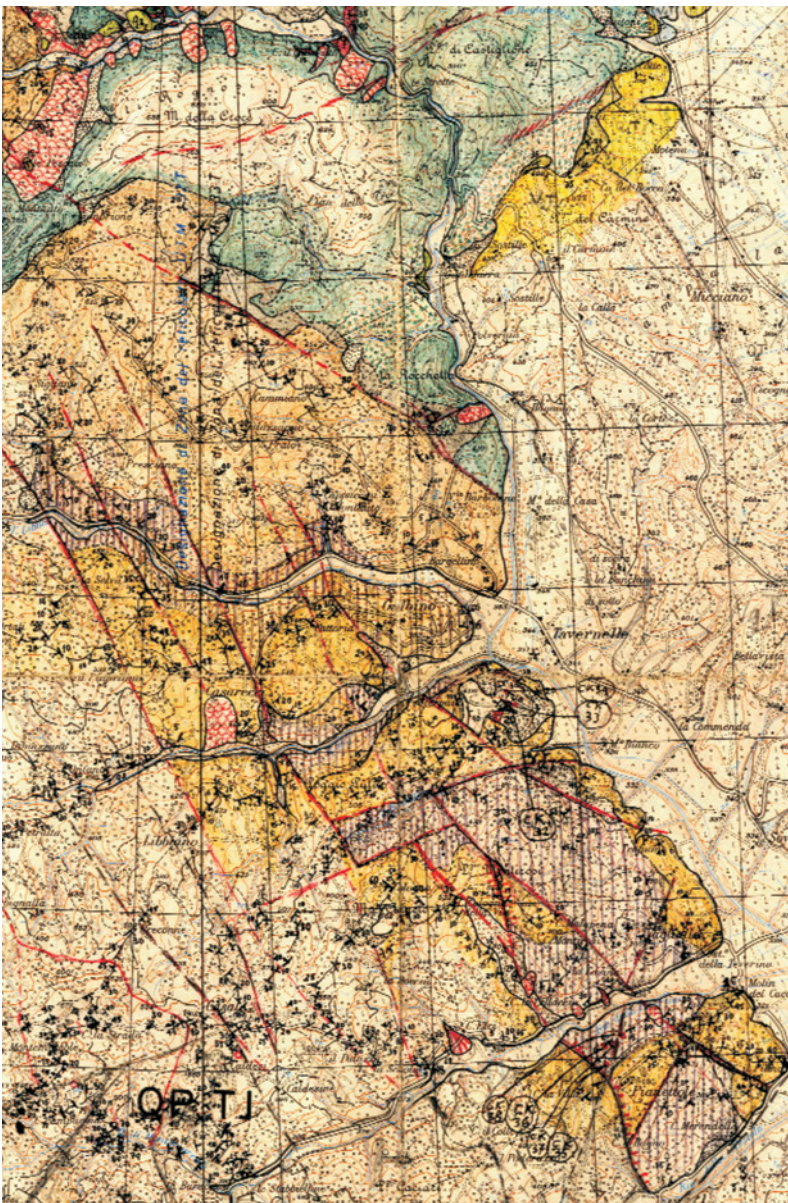
Fig. 2 - Originale d’autore, stralcio di una tavoletta rilevata alla scala 1:25.000 da Alfredo Jacobacci, ex direttore del Servizio Geologico d’Italia. - Original field map, at 1:25,000 scale, drawn by Alfredo Jacobacci, former director of the Geological Survey of Italy.

Come accennato nella premessa la nuova metodologia di stampa del Progetto CARG nasce con l’introduzione di una serie di possibilità offerte dalla gestione numerica del dato geologico combinata all’evoluzione delle tecnologie proprie della stampa. Ricordiamo che nelle prime Convenzioni ed Accordi di Programma CARG si faceva esplicito riferimento al sistema di stampa descritto nel precedente paragrafo con la consegna, da parte dei Contraenti CARG, dell’originale d’autore e del “calcopallido”, riservando al Servizio i successivi iter : la costruzione dello schema impianto colori e la produzione delle pellicole progressive necessarie alla stampa. Il primo foglio