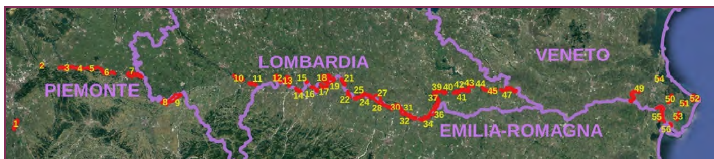
Figura 1. Distribuzione dei 56 interventi lungo l'asta fluviale.

Il progetto di rinaturazione del Po contribuisce a riattivare i processi naturali e a favorire il recupero della biodiversità, consolidando il corridoio ecologico fluviale, attraverso il ripristino del fiume e un uso più efficiente e sostenibile delle risorse idriche, con interventi di riqualificazione per la riattivazione e riapertura di lanche e rami abbandonati, la riduzione dell'artificialità dell'alveo con particolare riferimento all'abbassamento dei