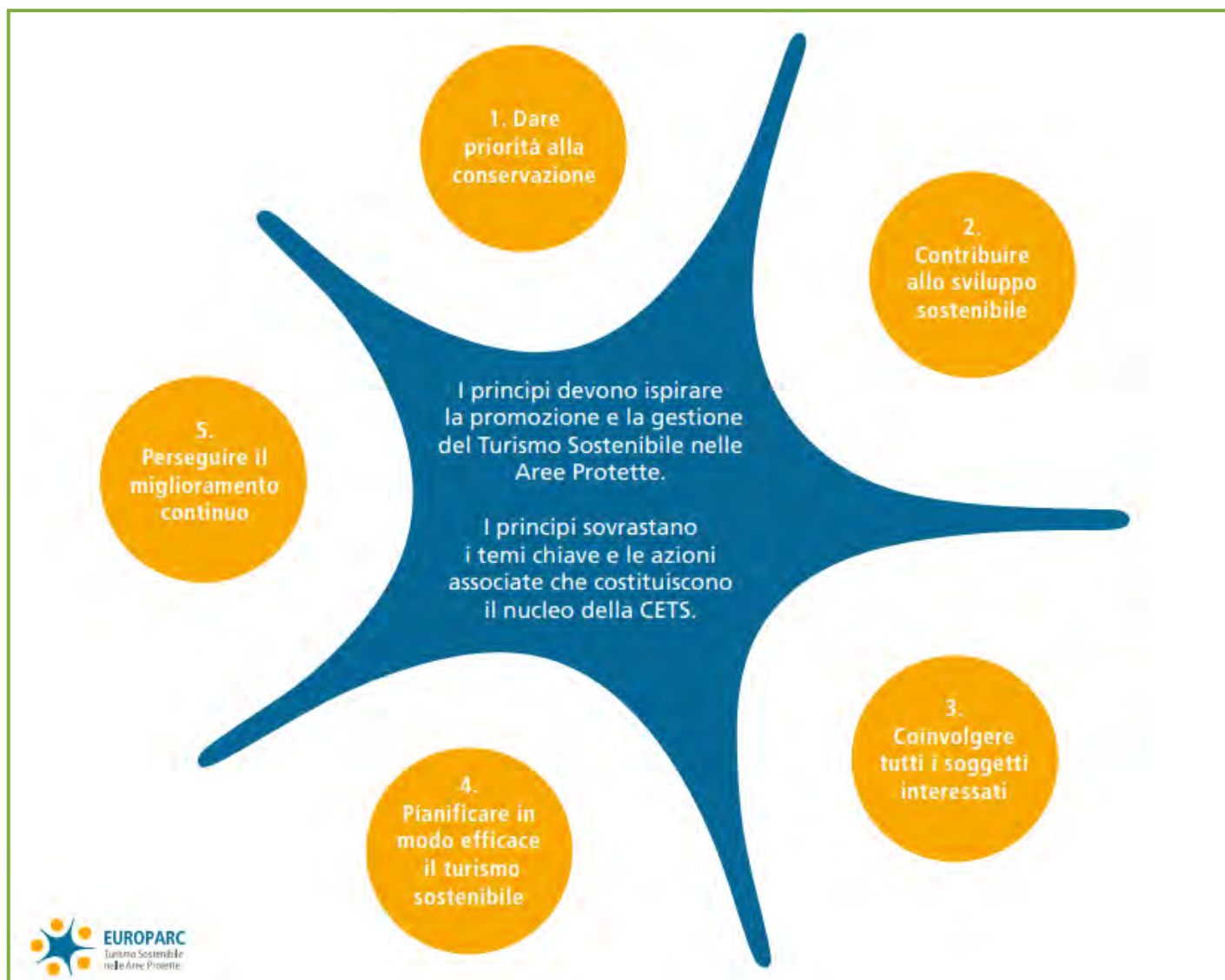
Figura 1. I cinque principi della CETS (fonte: Europarc Federation).