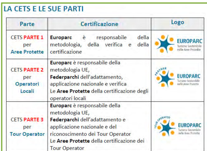
Figura 2. Le tre Parti della CETS.

La Parte 2 consente alle Aree Protette di Certificare operatori locali del turismo (con un approccio simile al Marchio di Qualità del Parco). La metodologia per la Parte 2 è stata definita da Europarc, attuata in Italia da Federparchi e viene adattata dalle Aree Protette in funzione delle diverse esigenze e caratteristiche locali, esclusivamente per quello che riguarda i disciplinari delle categorie di attività (accoglienza, ristorazione etc.). La Parte 2 può essere implementata localmente solo se l'area protetta ha già ottenuto la Certificazione CETS Parte 1. La Certificazione concessa agli operatori locali dura 3 anni e può essere rinnovata.