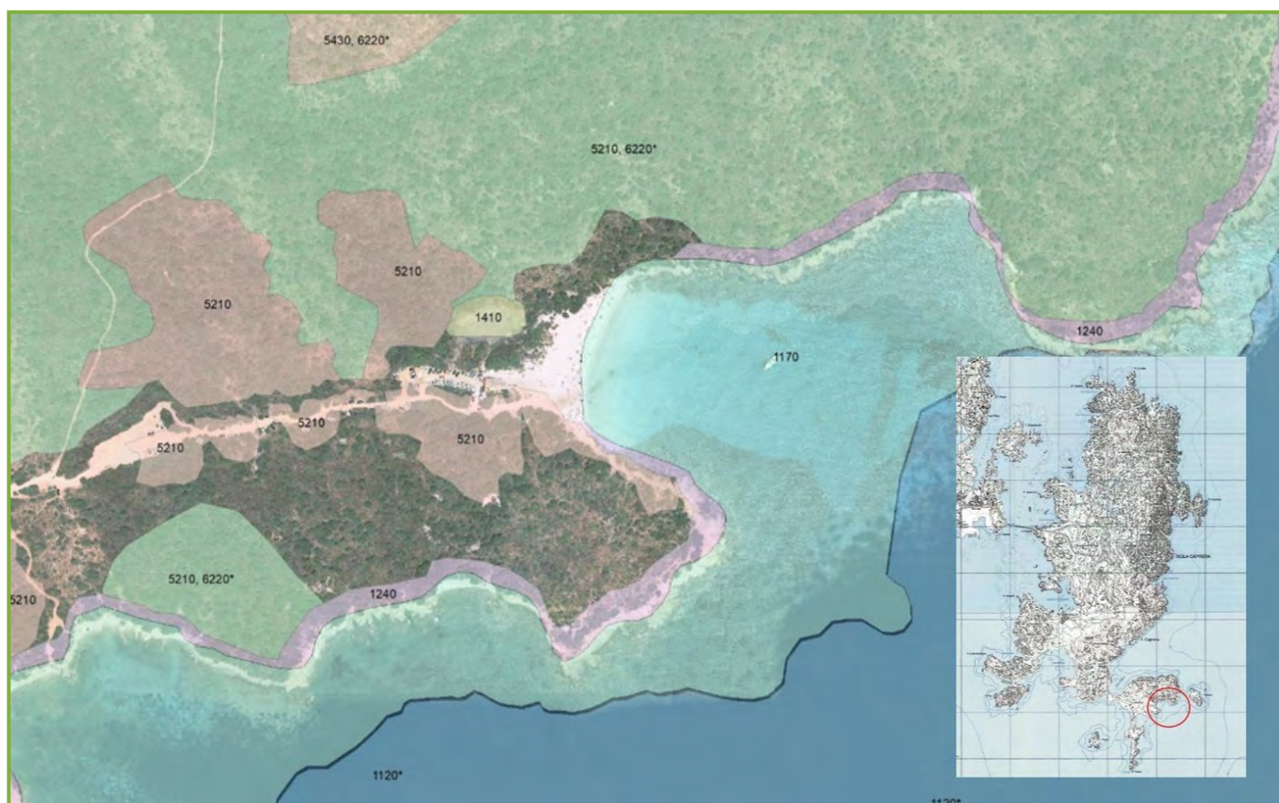
Figura 1. Inquadramento e Carta degli habitat della spiaggia del Relitto.

esposta ai venti del secondo quadrante, levante e scirocco, poco frequenti nell'Arcipelago, mentre offre riparo dai venti dominanti provenienti dai quadranti nord e nord ovest. In Figura 1, nel riquadro, è rappresentata l'intera Isola di Caprera su base della Carta Tecnica Regionale (CTR); il cerchio rosso indica la spiaggia del Relitto. Il resto dell'immagine rappresenta la tipologia e l'estensione degli habitat presenti nell'area ai sensi della Direttiva 92/43/CEE elencati nel Piano di Gestione del SIC, ora ZSC ITB010008 ( C.RI.TER.I.A. srl, 2016 ), che sono i seguenti: