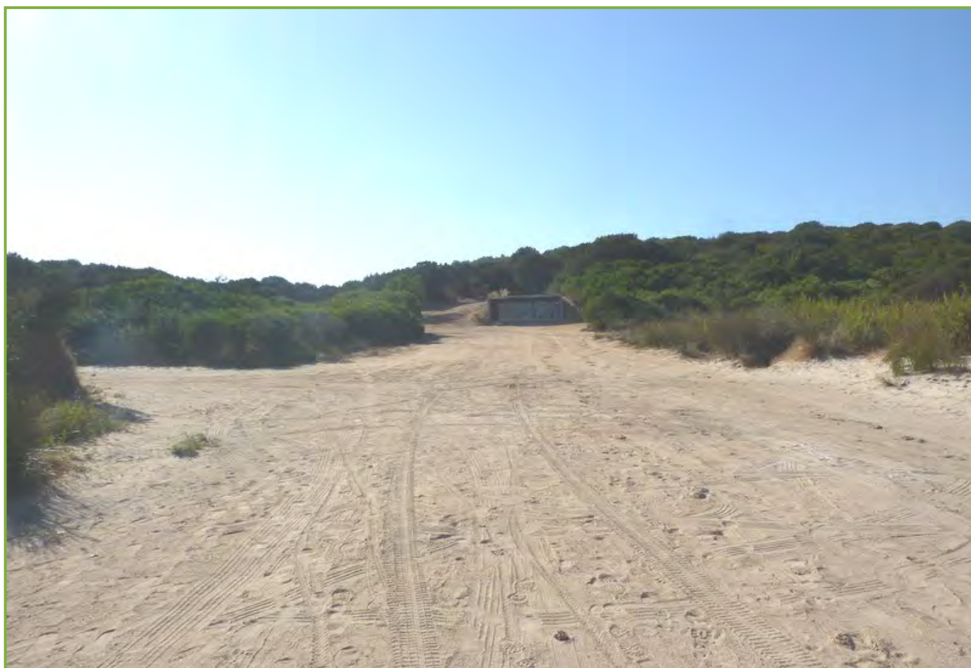
Figura 2. Poligono di tiro e spianata del parcheggio vista dalla spiaggia (foto da Archivio Ufficio ambiente parco, settembre 2010).