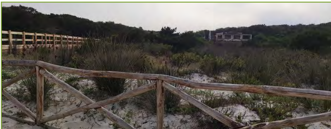
Figura 5. Nuova staccionata, passerella e nuovo sito di posizionamento del chiosco sopra il poligono di tiro (foto da Archivio Ufficio ambiente Parco, luglio 2024).

Nel luglio 2024 l'area nella quale era presente la zona di sosta e parcheggio delle auto mostra nuovamente i caratteri tipici della zona dunale con presenza di accumuli sabbiosi e di elementi vegetali dello stadio corrispondente. La superficie del poligono dell'habitat 1410 è di circa 2.200 m 2 , con aumento dell'estensione, quindi, di 900 m 2 rispetto al periodo 2006 – 2008 (Figura 4). Il sistema palo-cima, le staccionate e la passerella sono stati recentemente sostituiti con elementi nuovi (Figura 5). Comparando la Figura 5 con la Figura 2 si può osservare come la vegetazione sia tornata a popolare il retrospiaggia con una comunità pioniera e una copertura del suolo maggiore dell'80%.