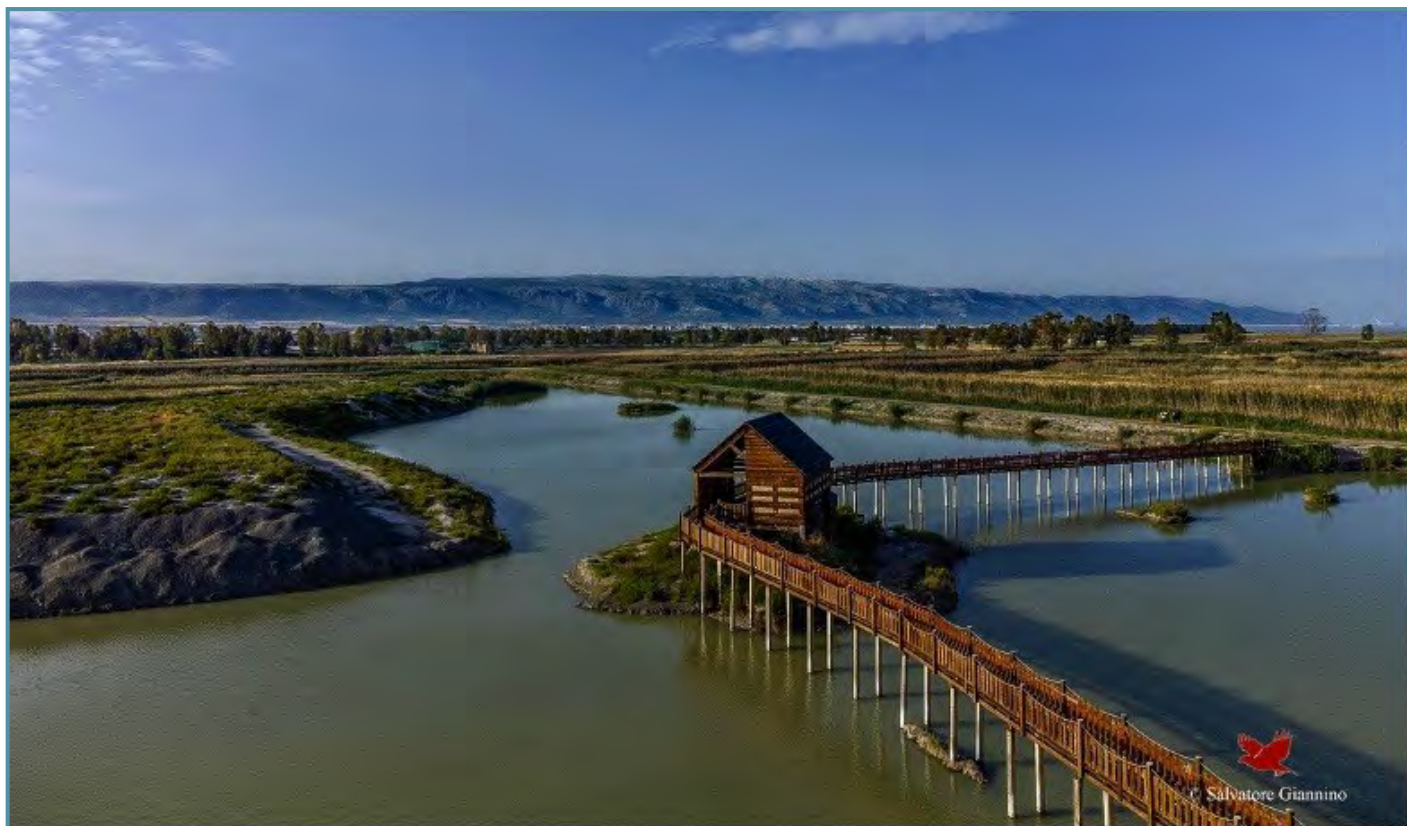
Figura 2. Vista panoramica del capanno e della passerella sulla laguna.

L'analisi delle interazioni ecologiche e socio-economiche è stata condotta attraverso la Nominal Group Technique (NGT; Delbecq e Van de Ven, 1971), un metodo partecipativo volto a favorire la convergenza di opinioni. Sono stati coinvolti sette esperti con differenti background tecnici, applicando un