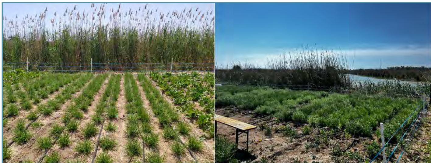
Figura 3. Sperimentazione agronomica. A sinistra: salicornia e bietola (2023 -2024). A destra: salicornia e agretti (2025).

disturbo all'ambiente. Le fasi sperimentali hanno riguardato la preparazione del suolo senza input chimici, il trapianto, l'irrigazione controllata con acqua salmastra, l'applicazione di fertilizzanti organici fluidi come fattori sperimentali (vermicompost e borlanda) e il monitoraggio della crescita, della copertura e della resilienza idrica delle piante. Le rese produttive ottenute sono state confrontate con valori di riferimento bibliografici e integrate in scenari di fattibilità agroecologica specifici per le zone umide costiere.