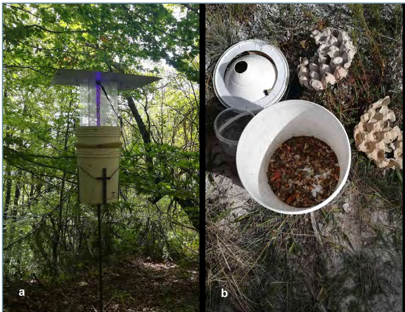
Figura 2. (a) Trappola luminosa UV-LED in funzione in uno dei siti di monitoraggio; (b) Contenuto di una delle trappole alla fine del campionamento.