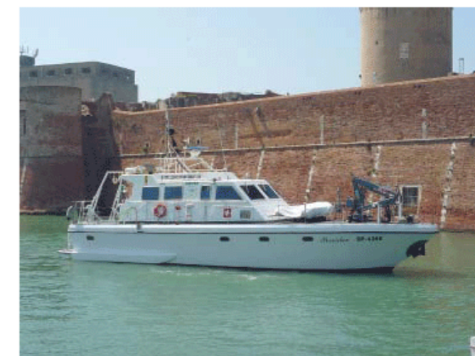
Battello oceanografico POSEIDON di Arpa Toscana

L o scorso 17 settembre su Rai 1 alle ore 23.40 nell'ambito di Speciale TG1 è andato in onda il reportage di Alessandro Gaeta "MARE DA SALVARE", che comprende anche un servizio fatto a bordo del battello oceanografico ARPAT Poseidon durante le attività di monitoraggio delle microplastiche, nell'ambito della Marine Strategy. Fonte: Arpat