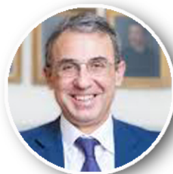
Sergio Costa Ministro dell'Ambiente e della Tutela del Territorio e del Mare