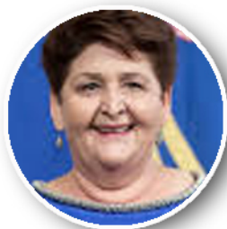
Teresa Bellanova Ministra delle Politiche Agricole, Alimentari, e Forestali