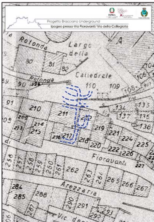
Fig. 9 - Ubicazione degli ipogei presso Via Fioravanti e Via Della Collegiata. - Location of the hypogea near Via Fioravanti and Via Della Collegiata.