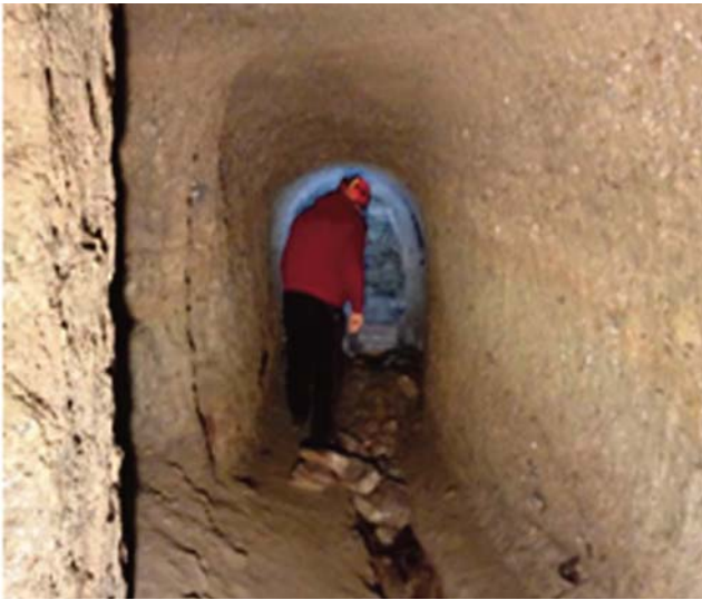
Fig. 8 - Un cunicolo al di sotto di Piazza Mazzini. - A tunnel underneath Piazza Mazzini.

in cemento armato. E' stato osservato che in alcuni tratti tale rivestimento risulta in soluzione di continuità con l'ammasso roccioso inficiando quindi la funzione statica della struttura. Non è stata rilevata la presenza di acqua. Nella figura 8 è possibile osservare uno dei cunicoli ivi presenti, in cui è evidente al centro la canaletta per il drenaggio dell'acqua.