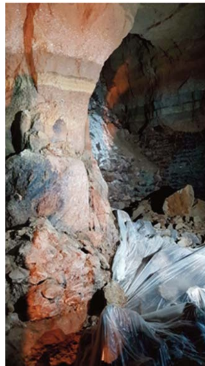
Fig. 11 - Crolli presso l'ipogeo di Via Fioravanti. - Collapses near the hypogeam of Via Fioravanti.