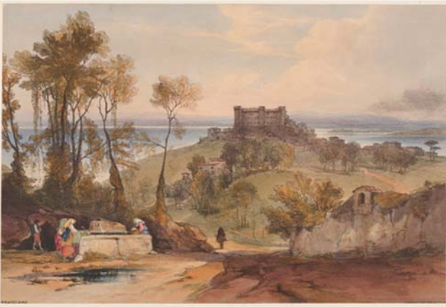
Fig. 2 - Panoramica del rilievo su cui sorge Bracciano da Eduard Lear 1841. - Overview of the relief on which Bracciano stands from Eduard Lear 1841.