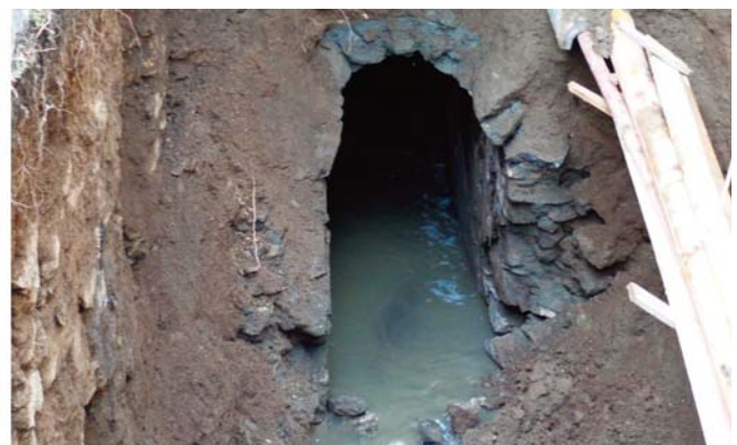
Fig. 13 - Voragine in Via del Fossato Novembre 2014 e galleria individuata. - Sinkhole in Via del Fossato November street 2014, and tunnel identified.