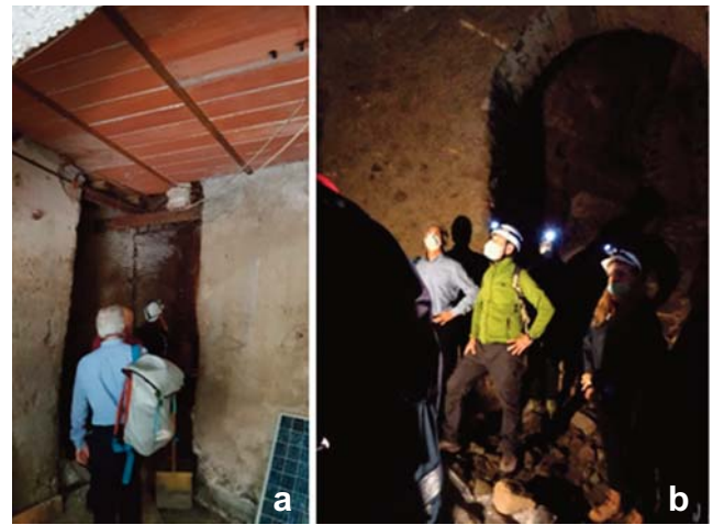
Fig. 10 - a) Accesso all'ipogeo; b) Ambiente ipogeo di via Fioravanti. - a) Access to the hypogeam; b) Underground space of via Fioravanti.

All'ipogeo di Via Fioravanti accede passando all'interno di una rimessa posta al civico n. 31. La figura 9 riporta lo stralcio di una planimetria catastale (estratto foglio 25) dove in giallo è presente lo sviluppo indicativo degli ambienti sotterranei. Sorpassato il varco visibile in figura 10 a si accede a un ambiente sotterraneo di ampie dimensioni con altezze che in alcuni tratti raggiungono circa i 5 m (Fig. 10 b).