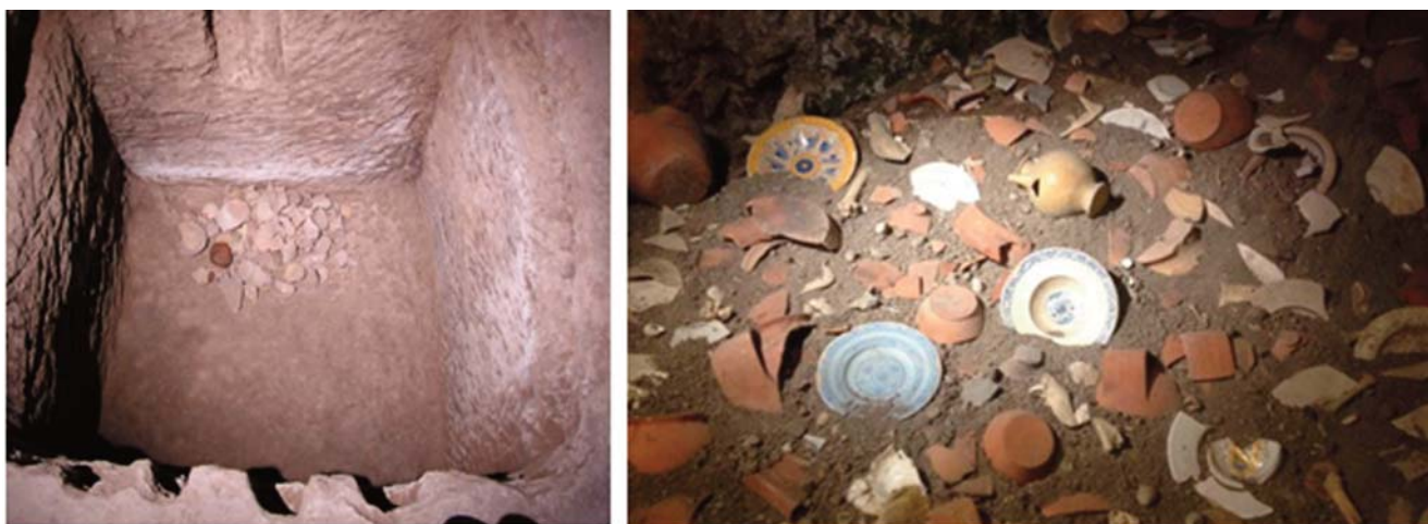
Fig. 4 - Esempi di cavità utilizzate come butti a) Pozzo della cava Orvieto (TN) b) Celleno (VT). - Examples of cavities used as butti a) Pozzo della cava Orvieto (TN) b) Celleno (VT).

Altre cavità sono state individuate a valle del paese come ad esempio presso il Fosso dell'Aspro. Si tratta di un cunicolo idraulico a sezione ogivale scavato sul fianco di un'altura. Esso presenta un'altezza di 3.00 m e una larghezza di 1.00 m, percorribile per circa 9.00 m, poi è interrotto da un crollo. Le pareti sono corrose dal passaggio dell'acqua, il suo utilizzo è stato probabilmente come canale di drenaggio realizzato per prosciugare l'acqua in eccesso e bonificare i terreni, il che testimonia la vocazione agricola del territorio. Le sue caratteristiche hanno fatto ipotizzare un'epoca etrusca per la sua costruzione. A poca distanza dal cunicolo, a una quota più elevata, vi è un complesso di due ambienti convergenti tra loro scavati nella roccia: l'ambiente