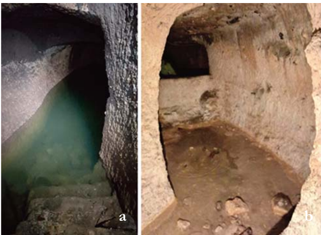
Fig. 12 - a) Vasca per la raccolta delle acque da cui si accede attraverso una scala, oggi sommersa; b) cunicolo presente sotto via della Collegiata.

All'ipogeo di Via della Collegeta si accede da un'abitazione civile (Fig.11); esso si estende anche al di sotto della strada in direzione di Via della Rotonda e della Cattedrale (Fig. 8). L'ipogeo è caratterizzato nella porzione al di sotto dell'edificio, di una cisterna per acqua, costituita da una vasca rettangolare (Fig.12, a, b). All'interno dell'ambiente ipogeo vi è una diffusa circolazione di acque di falda che determinano stillicidi diffusi in vaste aree dei cunicoli.