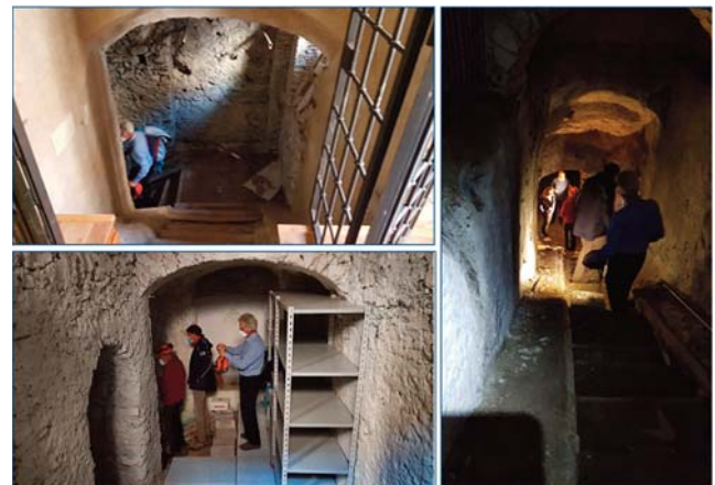
Fig. 7 - L'accesso alle cavità presenti sotto Piazza Mazzini. - Access to the cavities below Piazza Mazzini.

Il rilievo preliminare/speditivo effettuato ha permesso di osservare, in alcune porzioni, la presenza a terra di piccoli cumuli di blocchi ascrivibili a probabili crolli. Alcuni tratti di cunicolo risultano rivestiti