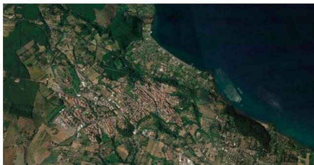
Fig. 1 - Vista dall'alto del Borgo di Bracciano (Roma) sul lago omonimo. - Aerial view of the village of Bracciano (Rome) close to the homonymous lake.

siva e scarsamente cementata, a matrice sabbiosa contenente mica, pirosseno, leucite e inclusi litici lavici e sedimentari termo-metamorfosati.