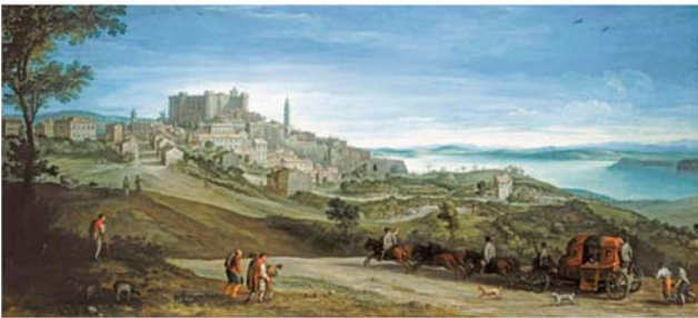
Fig.3 - Paul Brill, Veduta di Bracciano, 1620 circa, presso Art Gallery of South Australia. - Paul Brill, View of Bracciano, circa 1620, Art Gallery of South Australia.

Le attività artigianali, la necessità di approvvigionarsi di materiali da costruzione e di cisterne di acqua hanno indotto a partire da quegli anni gli abitanti a scavare il territorio della rupe generando un sistema di cavità ipogee, presenti anche al di sotto del castello.