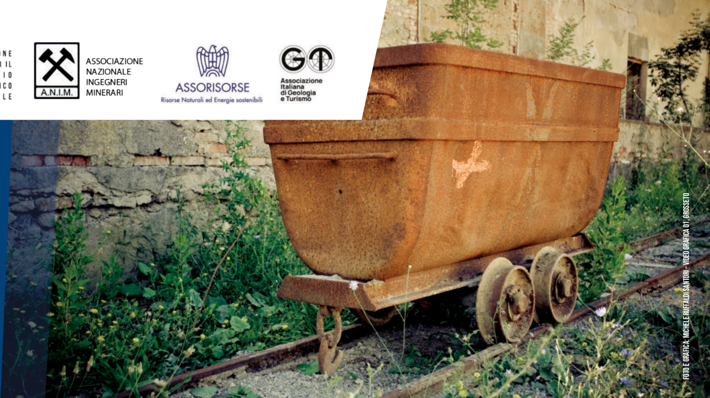
FOTO E GRAFICA: MICHELE BRUFALDI/SANTORI - VIDEO GRAFICA: OTI GRASSI/STUDIO