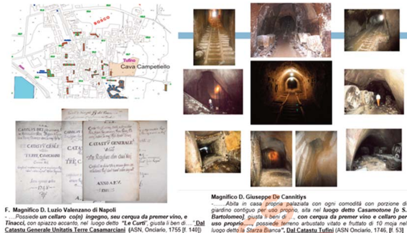
Fig. 3 - Le grotte-cantina. - The caves-cellar.

blocchi e la movimentazione dei veicoli; il rispetto di distanze tra i pozzi di accesso al giacimento sotterraneo, per non sconfinare in lotti vicini (12 m); e, infine, chiuse le aperture, la delimitazione dell'area con opportuni muretti e la posa di un albero longevo (ciliegio o arancio amaro).