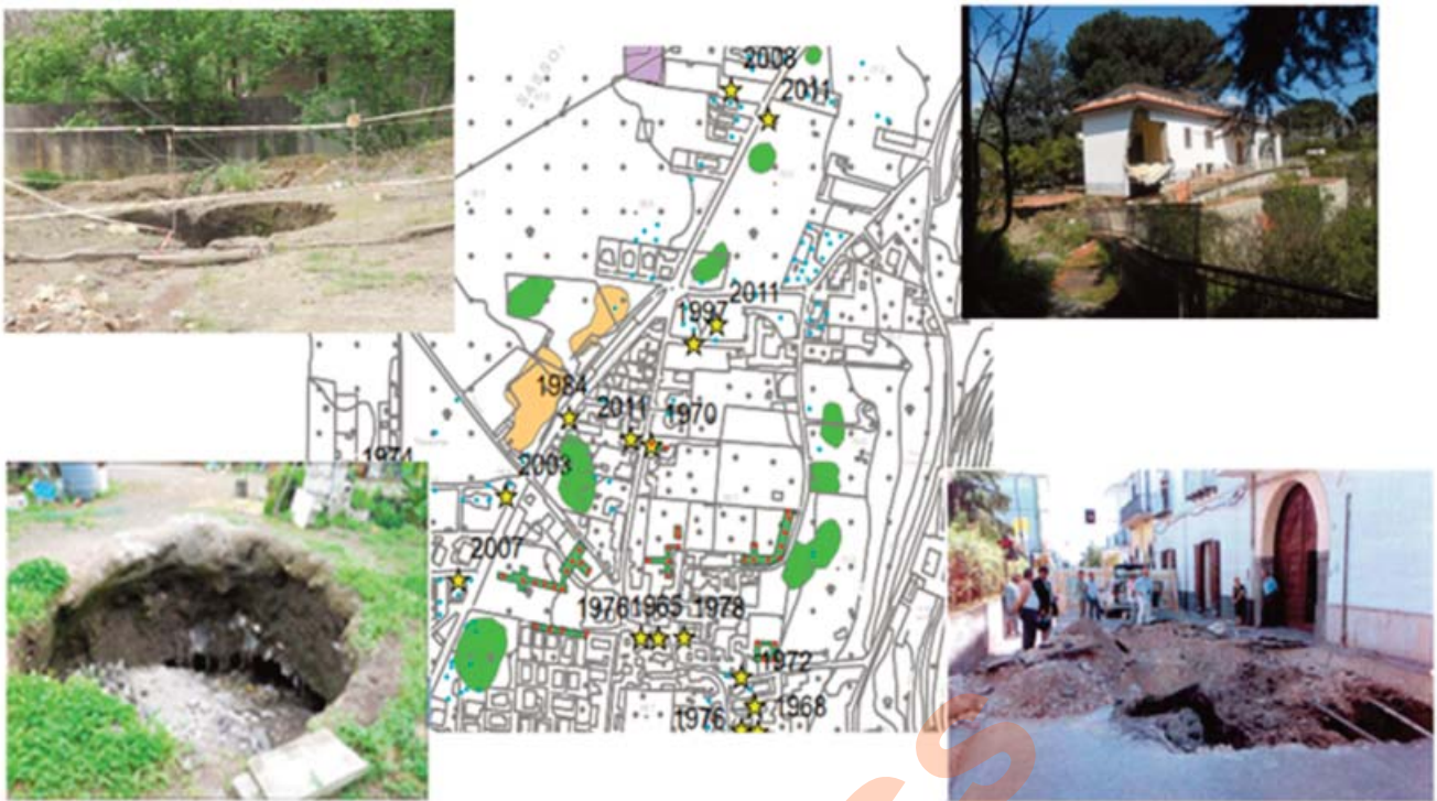
Fig. 4 - Voragini da sprofondamento. - Anthropogenic Sinkholes.

senza l'adozione di opportune misure di sicurezza, espone il sottosuolo a voragini da sprofondamento ( anthropogenic sinkholes ) che arrecano danni ad edifici e infrastrutture viarie (Fig. 4). L'esistenza di cavità nascoste riemerge dalla lettura di levate topografiche del XIX secolo e della prima metà del XX secolo, dove risaltano toponimi ( buca, monte, taglia ) collegati all'antica attività del prelievo del tufo o areali, talvolta molto estesi, interessati da deflessioni più o meno accentuate della superficie topografica (Fig. 6). Le metodologie di protezione ambientale hanno avuto grande impulso dalla ricerca documentaria (CACCAVALE, 2014) che, congiuntamente ai rilevamenti sul campo ed alla caratterizzazione dei siti, ha offerto una chiave di lettura della realtà sotterranea per l'individuazione delle pericolosità geologiche associate. Alcune ricostruzioni dell'andamento planimetrico delle cavità nolane sono state favorite dalla prospettiva di impiegare il soprassuolo per le attività edificatorie degli ultimi 30 anni, vincolando la qualità dell'esplorazione geologico-geofisica all'importanza delle costruzioni, peraltro avendo sempre una scarsa conoscenza degli spessori dei terreni di riem-