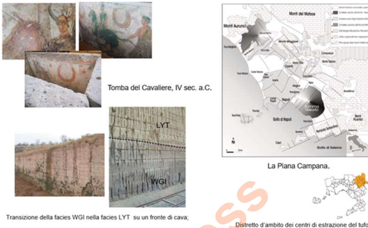
Fig. 1 - L'ignimbrite Campana e l'agro Nolano. - The Campanian Ignimbrite and the Nola countryside.