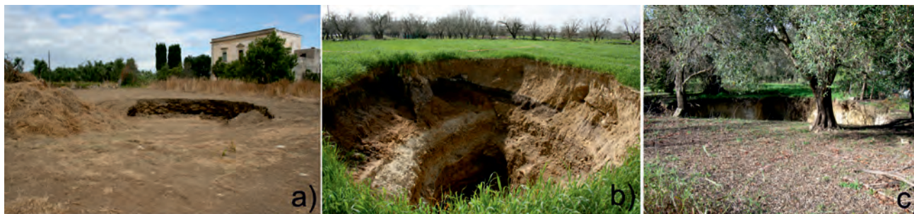
Fig. 7 - Recenti eventi di sprofondamenti a Cutrofiano, a causa della presenza di cave sotterranee in calcarenite: a) 15 luglio 2008; b) Marzo 2010; c) Ottobre 2010.

L'analisi è consistita sino a questo momento nella produzione di mappe e serie temporali di deformazioni e nelle aree prese in esame. Tali cartografie sono al momento valutate criticamente, sulla base della conoscenza della distribuzione spaziale