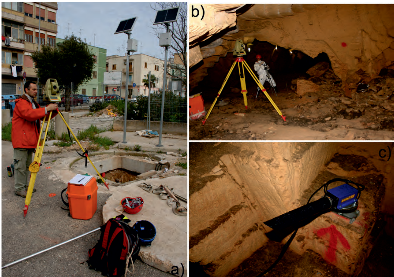
Fig. 4 - Monitoraggio topografico (a) e all'interno di ambienti ipogei (b, c) per la verifica di una eventuale evoluzione dello sprofondamento e delle discontinuità nell'ammasso roccioso.

L'Interferometria Differenziale SAR (DInSAR) è una tecnica di telerilevamento a microonde, basata sulla elaborazione di dati acquisiti da sensori radar. A differenza di gran parte dei sistemi ottici, tali sensori sono di tipo attivo, quindi trasmettono un segnale elettromagnetico alla frequenza delle