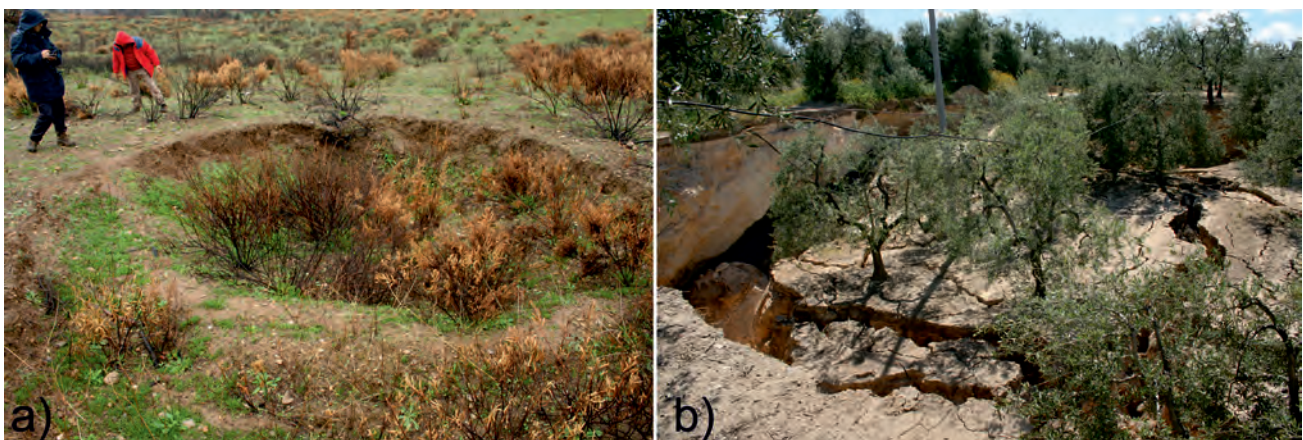
Fig. 1 - Esempi di sprofondamenti caratterizzati da diverse velocità di deformazione: a) lenti abbassamenti del suolo hanno prodotto la formazione di una blanda depressione sul terreno ( sinkhole da dissoluzione, San Basile, Cosenza); b) a partire da dissesti in profondità, la propagazione verso l'alto dei fenomeni di rottura, sino al raggiungimento della superficie, ha determinato il collasso ( sinkhole da collasso, Barletta).

Nell'ambito dei pericoli naturali, l'Interferometria Differenziale SAR satellitare (DInSAR) rappresenta un utile strumento per la identificazione e il monitoraggio di deformazioni superficiali a differenti scale spaziali. Negli ultimi anni le tecniche interferometriche sono infatti state applicate per l'analisi di una vasta gamma di pericoli naturali (frane, vulcani, terremoti, ecc.). Sono invece estremamente scarse nella letteratura scientifica internazionale le applicazioni che riguardano ambienti carsici. In questa nota si descrivono i risultati preliminari dell'applicazione della tecnica avanzata SBAS-DInSAR al territorio carsico pugliese, al fine di comprendere le potenzialità di queste tecniche di telerilevamento nel rilevare la presenza di movimenti precursori nello stadio finale di fenomeni di sinkhole .