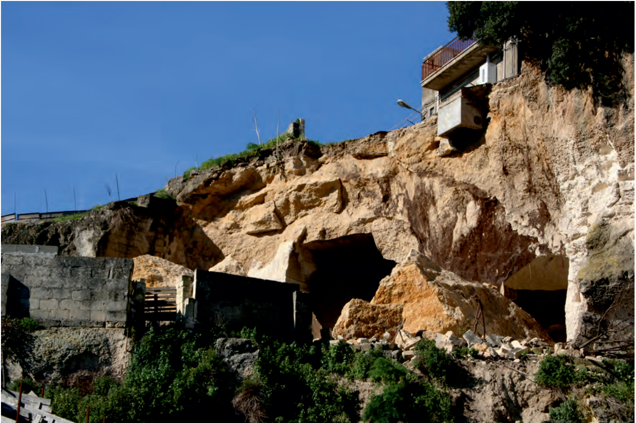
Fig. 3 - Il crollo della zona di accesso a una cava sotterranea presso Ginosa di Puglia ha tranciato parte della sede stradale e minacciato la palazzina visibile al margine destro della fotografia.

- Collapse of the access to an underground quarry at the outskirts of Ginosa di Puglia has destroyed a stretch of the province road, at the same time threatening the building visible at the right margin of the picture.