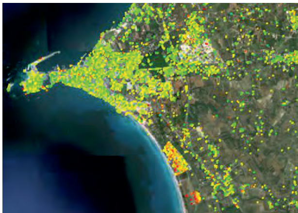
Fig. 6 - Mappa di velocità di deformazione a scala locale relativa alla città di Gallipoli (LE), ottenuta mediante elaborazione di immagini SAR ENVISAT acquisite in orbita ascendente (intervallo temporale: 2003-2010). - Ground deformation velocity map at local scale relevant to the urbanized area of Gallipoli (ENVISAT ascending dataset, time interval 2003-2010).