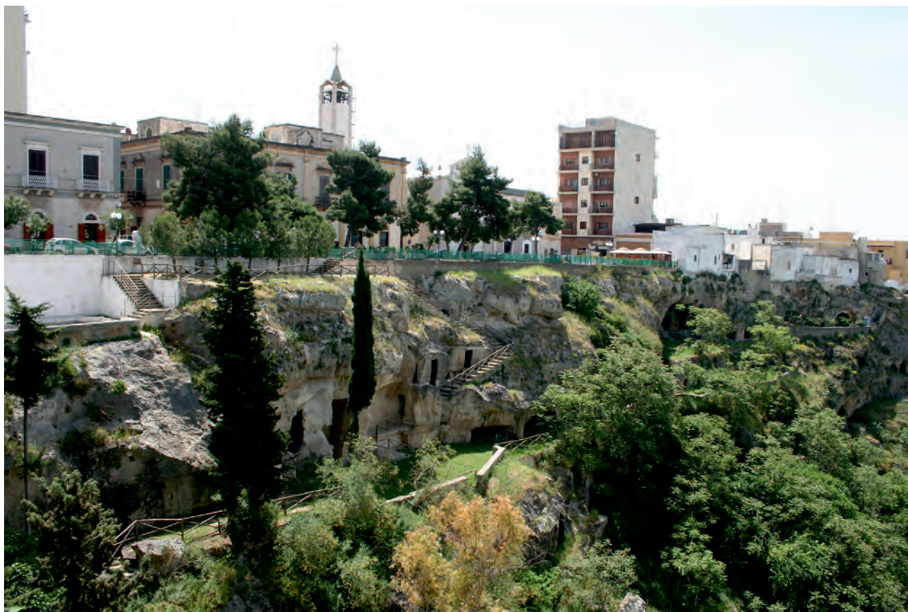
Fig. 2 - Diffusi vuoti sotterranei di origine antropica al di sotto delle attuali città possono essere all'origine di pericoli per l'ambiente urbano (Massafra). - The many underground voids excavated by men in different epochs, nowadays located below the present towns, may be at the origin of danger to the urban area (Massafra).